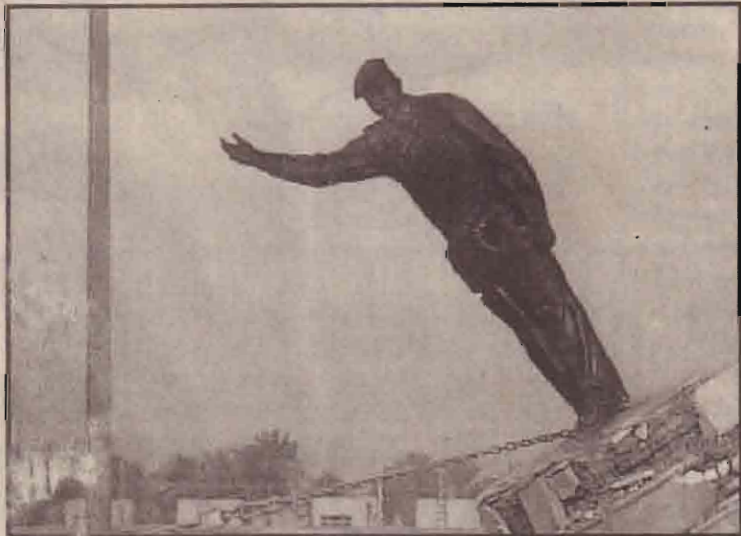
பஸ்ரா நகரத்திலுள்ள சனாதிபதி சதாம் ஹுசைனின் உருவச்சிலையை பிரித்தானிய கூட்டுப்படையினர் உடைத்து எறிவதைக் காண்க.

தமிழக அரசு கல்லூரியை இடித்து விட்டு அதில் அரசு தலைமைச் செயலகத்தை அமைக்க முடிவு செய்திருந்தமை குறிப்பிடத்தக்கது.