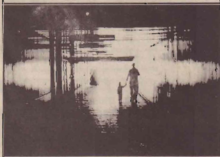
ஈராக்கிய பொதுமக்கள் தனது மகனின் கையைப் பிடித்தபடி பாக்தாத் வைத்தியசாலையொன்றுக்குள் செல்கின்றார்.