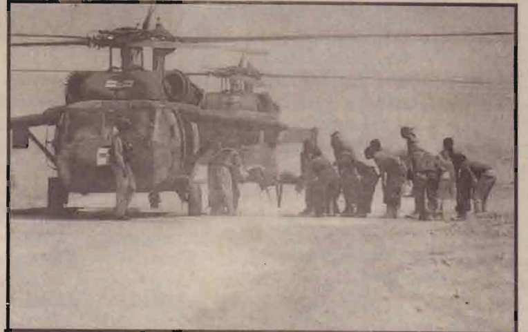
பாக்தாத்திற்கு வெளியே அமெரிக்க கூட்டுப்படை வீரர்களின் காயப்பட்ட போர் வீரர்களை உலங்கு வானூர்தியில் ஏற்றுக்கொள்ளும்.

வரும் நிலையில் ஈராக் பேரழிவு ஆயுதங்களைப் பாவித்து வரும் சாத்தியக் கூறுகள் ஏதும் இல்லை யென அமெரிக்க கூட்டுப்படை அதிகாரி பிரிகேடியர் ஜெனரல் 'வின்சன் புறுக்ஸ்' கூறியுள்ளார். எனினும் பேரழிவு ஆயுதங்களின் அச்சுறுத்தல் முற்றாக நீங்கிவிடவில்லை எனவும் தெரிவித்துள்ளார்.