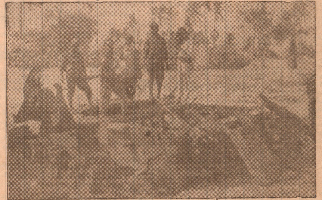
புலோப்பனை சமரில் சிறிய டாங்கி

இதை அடுத்தே இராணுவம் கிளாலியை விட்டு பின்வாங்கியுள்ளது.