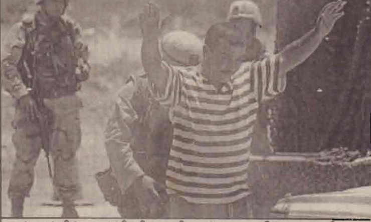
பாக்தாத்தில் சனாதிபதி மாளிகைக்கு அருகில் அமெரிக்கப் படையினர் ஈரானியர் ஒருவரைச் சோதனைக்குக் கிண்பித்தனர்.

அல்-ஹெய்தா பயங்கரவாத அமைப்பின் புதிய தளமாக பாகிஸ்தான் மாறிவிட்டது என்று துணைப்பிரதமர் அத்வானி கூறியுள்ளார். சர்வதேச பயங்கரவாதத்திற்கு ஊக்கமும், நடவடிக்கை ஆதரவும் பாகிஸ்தானில் இருந்துதான் முக்கியமாகக் கிடைக்கின்றது என்பது அனைவரும் அறிந்ததே என்று சிக்காகோவில் நடைபெற்ற நிகழ்ச்சியொன்றில் பேசுகையில் அத்வானி கூறியுள்ளார். பாகிஸ்தானில் இருந்துகொண்டு இந்தியாவுக்கு எதிரான நடவடிக்கைகளில் ஈடுபடும் குழுக்களுக்கு அல்-ஹெய்தா அமைப்புடன் தொடர்பு உள்ளதாகவும் அவர் கூறியுள்ளார். ஆனால் அத்வானியின் இந்தக் குற்றச்சாட்டை பாகிஸ்தான் மறுத்துள்ளது.