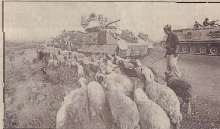
அமெரிக்க ரோந்து வாகனத்துக்கு அருகில் தமது மந்தைகளை ஓட்டிச் செல்லும் ஈரானியர்

(மொஸ்கோ) பயங்கரவாத நடவடிக்கைகள் குறித்து இந்தியத் தலைவர்களுடன் ரஷ்ய வெளிவிவகார அமைச்சர் டிச்சுவாந்தை நடத்தவுள்ளார். இதன் முந்தக்டமாக பாகிஸ்தான் செல்லவுள்ளார், அடுத்து இந்தியா சென்று, பிரதமர், வெளிவிவகார அமைச்சர், பாதுகாப்பு அமைச்சர் ஆகியோருடன் பேச்சுவார்த்தை நடத்தவுள்ளார்.