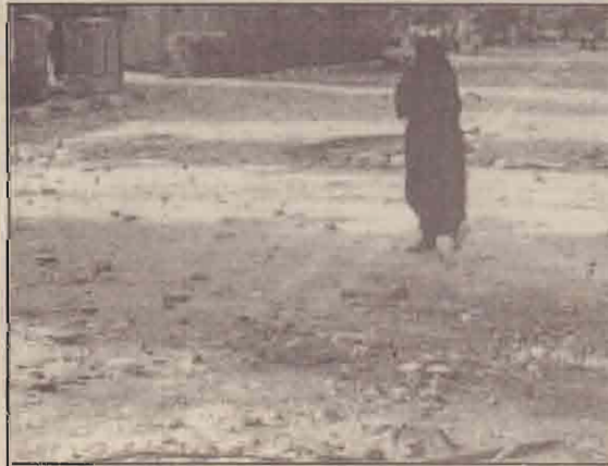
தெஹ்ரானில் மாணவர்களின் ஆர்ப்பாட்டம் தீவிரத்தில் முடிந்த சம்பவத்தில் தீயினால் எரிந்த பகுதிகளுக்கு உடக கடந்துசெல்லும் ஈரானியப் பெண்

மேலும் போராட்டங்களைக் கட்டுப்படுத்த கடுமையான நடவடிக்கைகள் பிரயோகிக்கப்படும் என்றும் ஈரானிய அரசு எச்சரிக்கை விடுத்துள்ளது.