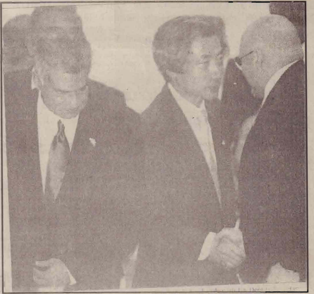
காட்டுவதாலேயே புலிகள் அரசுடன் முரண்படுவது போன்று தென்பகுதி மக்களும் முரண்பட வாய்ப்பாகும்.

(உதவிகள் கிடைக்க முன்பு) உதவிகள் கிடைத்தால் இளைஞர்