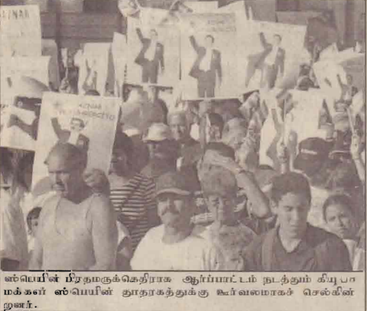
ஈரானியப் பிரதமருக்கெதிராக ஆர்ப்பாட்டம் நடத்தும் கியூபா மக்கள் ஸ்பெயின் தூதரகத்துக்கு உள்வலமாகச் செல்கின்றனர்.

பயங்கரமான சார்ஸ் நோய் காரணமாக சீனாவின் நான்கு பகுதிகளுக்குச் செல்வதற்கு விடுக்கப்பட்டிருந்த பயணக்கட்டுப்பாடுகளை நேற்று முன்தினம் உலக சுகாதார நிறுவனம் நீக்கி விட்டது. எனினும் பீஜிங்கிலும், தாய்வானிலும் இன்னமும் சார்ஸ் நோய் கட்டுப்படுத்தப்படாமல் இருப்பதால், அங்கு செல்வதற்கான பயண எச்சரிக்கைகள் விலக்கப் படவில்லை. கனடாவில் சார்ஸ் மீண்டும் தொடங்கியிருப்பதால் சுகாதார அதிகாரிகள் விழிப்பு நிலையைக் கைவிடக் கூடாது என்றும் உலக சுகாதார ஸ்தாபனம் எச்சரித்துள்ளது.