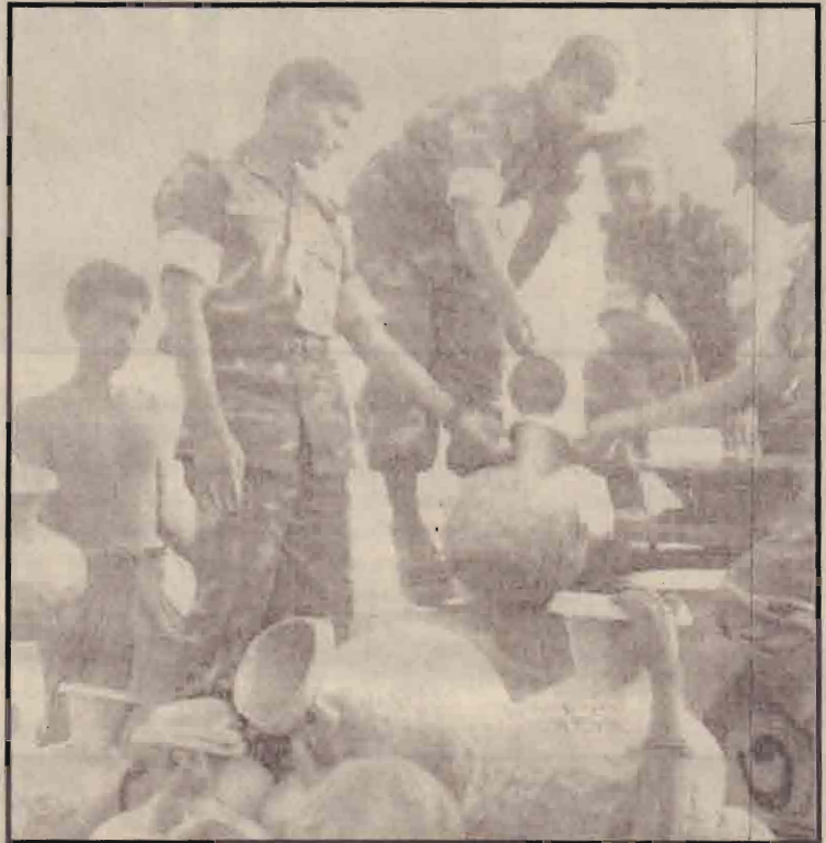
வரட்சியால் பாதிக்கப்பட்ட டாக்கா வாசிகளுக்கு குடிநீரை வழங்கும் செய்யும் பங்களாதேஷ் படையினர்.

நபர்களைத் தங்களிடம் சரணடையுமாறும் அமெரிக்கா கேட்டுள்ளது. அந்தக் கட்சியோடு தொடர்புடைய ஆவணங்கள் வைத்திருப்பது சட்டவிரோதமானது என்றும் அவ்வாறானவர்கள் உடனடியாகக் கைது செய்யப்படுவார்கள் என்று அமெரிக்க இராணுவம் தெரிவித்துள்ளது.