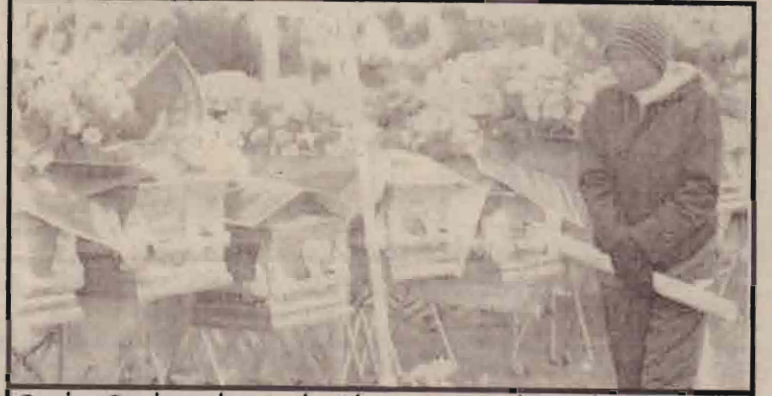
பெதலகேம் பஸ் விபத்தில் பலியானவர்களின் உறவினர்கள் தமது இறந்த உறவினரை அடையாளம் காண சவப் பெட்டிகளைச் சோதனைப்படுகின்றனர்.

எல்லை கடந்த பயங்கரவாதத்தை ஊக்குவிப்பதை பாகிஸ்தான் நிறுத்த வேண்டும் என்றும் கூறியுள்ளார்.