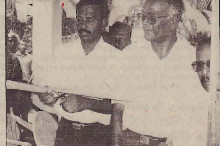
திருமலை மாவட்ட அரசியல்துறைப்பொறுப்பாளர் தலைவர் இப்பணிமனையைத் திறந்துவைக்கிறார்.