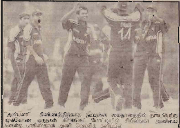
“அன்பலா” கிண்ணத்திற்காக தம்புள்ள மைதானத்தில் நடைபெற்ற முக்கோண ஒருநாள் கிரிக்கெட் போட்டியில் சிறிலங்கா அணியை வென்ற பாதிஸ்தான் அணி வெற்றிக் களிப்பில்

தொடரலாம் என்ற அழிகுறி தென்படுவதே இதற்குக் காரணம் என அறிவிக்கப்பட்டுள்ளது.