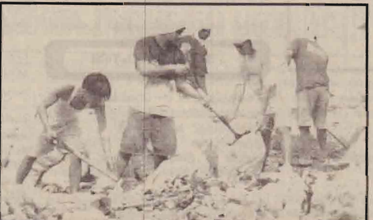
சார்ஸ் வைரஸ் பரவாதிடுக்க அரசு எடுக்கும் நடவடிக்கைகளில் ஒன்றாக மணலா நகரில் குப்பைகளை அகற்றும் பிஸ்ப்பைன்ஸ் நகராசுத்தீத் தொழிலாளர்கள்.

பொருளாதார, விஞ்ஞான, கானது மற்றைய பணிக் குழு தொழில் நுட்ப ஒத்துழைப்புக் ஆகும்.