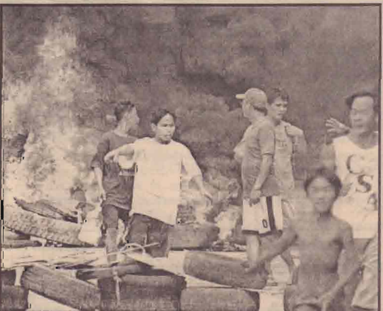
பிளிப்பைன்ஸ் தலைநகர் மணிலாவில் ஒரு குடியிருப்பு பகுதியை அகற்ற அந்த நாட்டு அரசு முடிவு செய்தது. இதற்காக அழிப்புக்குழுவினரும், பொலிசாரும் அங்கு அனுப்பப்பட்டனர். அவர்களை தடுக்க குடியிருப்பில் வாசியப்பவர்கள் கலவரத்தில் சடுபட்டனர் எனக் கூறப்பட்டது.

எல்லைப்பறத்ததைத் திறக்கும் இணக்கத்தின் கீழ் எல்லைப்பறத்தின் முழுக்கட்டுப்பாட்டையும் பலஸ்தீனர்களே கொண்டிருப்பர்.