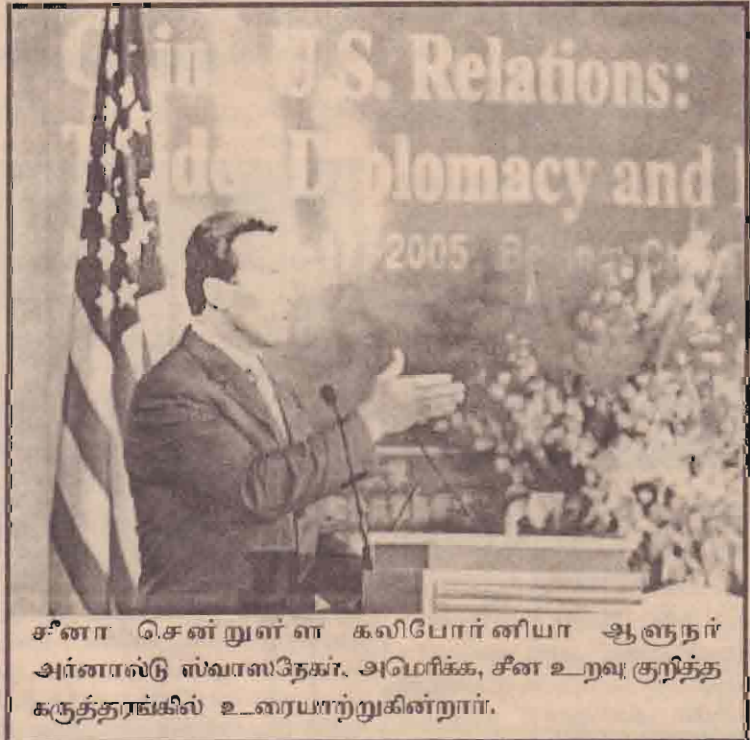
சீனா சென்றுள்ள கலிபோர்னியா ஆளுநர் அர்னால்டு ஸ்வாஸ்தேகர். அமெரிக்க, சீன உறவு குறித்த கருத்தரங்கில் உரையாற்றுகின்றார்.

இந்தக் குண்டு வெடிப்புக்கு சில நிமிடங்களுக்கு பின்பு அங்குள்ள ஒரு ஐந்து நட்சத்திர விடுதி அருகே காடில் குண்டு வெடித்தது. இதிலும் அங்குள்ள கடைகள் விடுதிகள் சேதமடைந்தன.