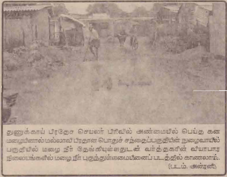
துணுக்காய் பிரதேச செயலர் பிரிவில் அண்மையில் பெய்த கனமழையினால் மல்லாவி பிரதான பொதுச் சந்தைப்பகுதியின் நுழைவாயில் பகுதியில் மழை நீர் தேங்கியுள்ளதுடன் வார்த்தகரின் வீயாபார நிலையங்களில் மழை நீர் புகுந்துள்ளமைபினைப்படுத்தில் காணலாம். (ட.டம், அன்றணி)

(அலுவலக செய்தியாளர்) மறைக்காலத் தொற்று நோயிலிருந்து பாதுகாத்தல் தொடர்பான சுகாதார விழிப்புணர்வுக் கருத்தாட்டம் நிகழ்வு இடம்பெற்று வருகிறது. தமிழீழ சுகாதார சேவைகளின் ஒருங்குபடுத்தலில் கடந்த சனிக்கிழமை செஞ்சேலை மாணவர்கள் மற்றும் சமையல்கூடப் பணியாளர்கள் உள்ளடங்கலாக முப்பது பேருக்கும் கரைச்சி வடக்கு ப.நோ.கூ.சங்க உத்தியோகத்தர்கள், கிளை முகாமையாளர்கள் ஆகியோருக்கு, நோய்கள், உணவு கையாளும் நிலையங்களின் உணவுச் சுகாதாரத் தொடர்பாகவும், மதியம் ஒரு மணிக்கு இளந் தென்றல் வாணியப்பணியாளர்களுக்கு டெர்சுக்காய்ச்சல், சுற்றாடல் சுகாதாரம் தொடர்பாகவும் விழிப்புணர்வுக் கருத்தாட்டம் செயற்பாடுகள் மேற்கொள்ளப்பட்டன. (கு.தி)