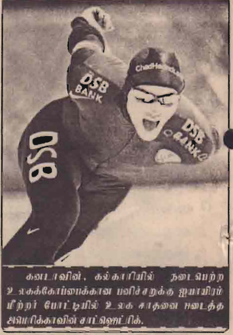
கபாலாவின், கல்காபியில் நடைபெற்ற உலகக்கோப்பைக்கான மலிச்சுருக்க ஸ்பாய்லர் பற்றி போட்டியில் உலக சாதனை படைத்த சிவாபிக்காவின் சாஷிஷாபி.

4-1 என்ற முன்னிலையில் வெல்லும் பட்சத்தில் 112 புள்ளிகள் பெற்று நான்காவது இடத்தைப் பிடிக்கலாம். 3-2 என்ற முன்னிலையில் வென்றால் 110 புள்ளிகளுடன் அதே நான்காவது இடத்தைப் பெறலாம்.