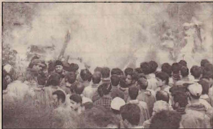
காஷ்மீர் தீவிரவாதிகளால் நேற்று முன்தினம் படுகொலை செய்யப்பட்ட 24 இந்துக்களின் சடலங்களும் ஒன்றாகத் தீயில் சங்கமமாகின்றன.

மேலும் ஈராக்கிய சம்பவங்கள் குறித்து சர்வதேச தொலைக்காட்சி நிறுவனங்கள் ஒருதலைப்பட்சமான செய்திகளை ஒளிபரப்புவது பற்றிய குற்றச்சாட்டுக்களும் பிரான்ஸின் கவனத்தைத் திசை திருப்பி உள்ளன.