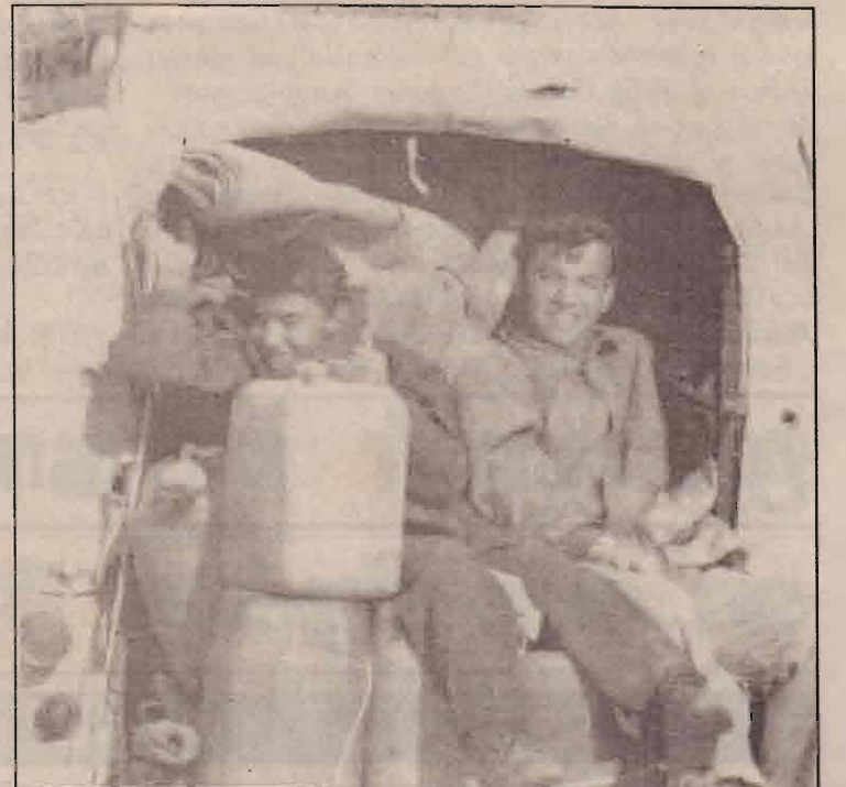
பாக்தாத்திலிருந்து 150 கி.மீ தூரத்தில் அமைந்துள்ள கலார் என்ற இடத்தில் இருந்து வெளியேறும் அகதிகள்