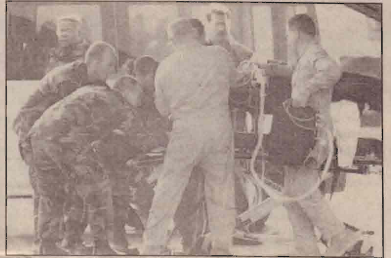
காயப்பட்ட தமது சகாவை C-141 ரக போக்குவரத்து விமானத்திலிருந்து தூக்கிச் செல்லும் அமெரிக்கப் படையினர்

செய்தி வெளியிடுகையிலேயே மேற்கண்டவாறு கூறினார். அங்கு அவர் மேலும் தெரிவிக்கையில் ஈராக்கில் 26 மில்லியன் சதாம் ஹுசைன்கள் உள்ளனர். அமெரிக்காவுக்கு எதிராக அரபு சகோதரர்கள் செயற்பட வேண்டும் என சிரியாவில் வைத்து அவர்