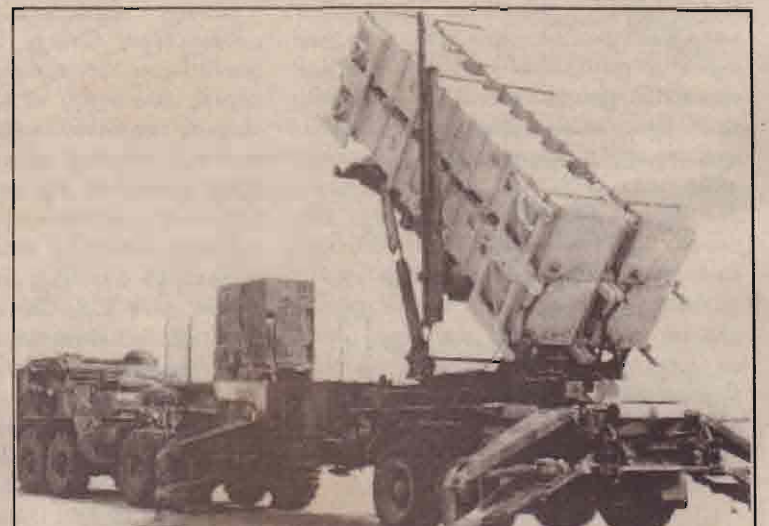
குவைத் விமானப்படகைச் சொந்தமான அமெரிக்கத்தயாரிப்பு பட்டியல்வகை ஏவுகணை குவைத் எல்லையில் நிறுத்தப்பட்டுள்ளது.