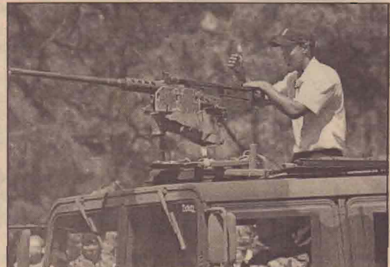
போர்ட் புரோக் முகாமுக்கு கோல்ப் பயிற்சிக்காக வருகை தந்துள்ள ரைக்ரூட் இவர் இராணுவப் பயிற்சிக்களிலும் ஈடுபட்டுள்ளார்.

கொல்லப்படுவதை ஐரோப்பிய சமூகத் துடன் இணைந்து எகிப்து, ஜோர்தான் ஆகிய நாடுகளும் தங்களது கண்டனங்களைத் தெரிவித்துள்ளன. ஹமாஸ் இயக்கத்தின் முன்னாள் தலைவரும் ஆன்மீகத்தலைவருமான ஜாசீன் அண்மையில் இஸ்ரேலியப் படையினரின் ஹெலிகொப்டர் தாக்குதலுக்கு இலக்காகி கொல்லப்பட்டமையும் அதனைத் அடுத்து ஹமாஸ் இயக்கத்தின் தலைவராக நியமிக்கப்பட்டவரே தற்போது கொல்லப்பட்டுள்ளார். என்பதும் குறிப்பிடத்தக்கது.