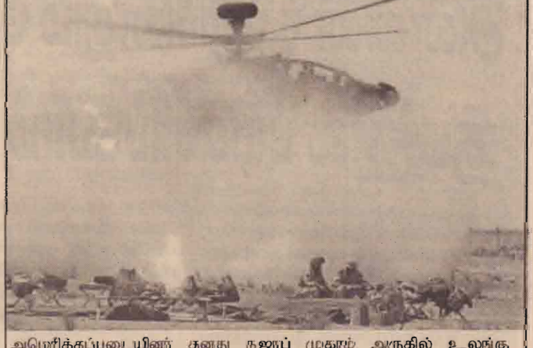
அமெரிக்கப்படையினர் தனது நண்பர் முகாம் அருகில் உலங்கு வாறான்தியில் இருந்து குதிகின்றனர்.

ரிக்க சனநாயகக் கட்சிச் செனட்டர் புஷ்ஷின் வியட்நாம் என்று அட்டவெட். கெஷு ஈராக் சனாதிபதி தெரிவித்துள்ளார்.