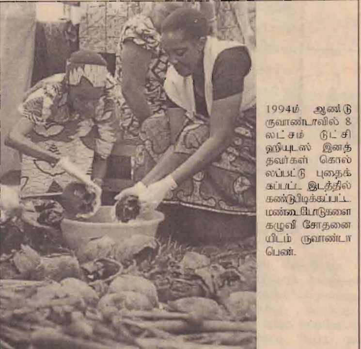
1994ம் ஆண்டு ருவாண்டாவில் 8 லட்சம் ரூட்சி ஹியூஸ் இனத்தவர்கள் கொல்லப்பட்டு புதைக்கப்பட்ட இடத்தில் கண்டுபிடிக்கப்பட்ட மண்ணட்பிடுகளை கழுவி சோதனை யிட்டம் ருவாண்டா பென்.