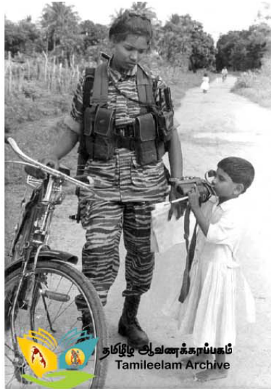
தமிழ்த் தலைவர்களுக்காக Tamileelam Archive

வடக்கு கிழக்கில் பரவலாக நிலவும் போஷாக்கின்மை மூன்று ஏற்கனவே குறிப்பிட்டுள்ளோம். கொழும்பு அரசு கொடும் சிபாய் தாழ்த்துவகம் நடத்திய பெருமாள் தாரத்தையும் எம் மக்களின் வலுமையும் போஷாக்கின்மைபின் கட்டுக்காணிசொக அமைகின்றன. உலகவங்கியின் மனித மேம்பாட்டு அய்வகம் (HUMAN DEVELOPMENT UNIT, WB) வெளியிட்ட பெயர்வாரி, 2005 அறிக்கை வட கிழக்கில் நிலவும் போஷாக்கின்மை இலங்கைத்தீவின் பிற பகுதிகளிலும் பார்க்க கடுமையாக இருப்பதை உறுதிப்படுத்துகிறது. வட கிழக்கு போஷாக்கின்மை 46 விதமாகவும் இலங்கைத்தீவின் பிற பகுதிகளில் அது 29 விதமாக இருப்பதை, ஆகக் கடுமையான போஷாக்கின்மை மட்டக்களப்பிலும் (53%) அதற்கடுத்ததாக