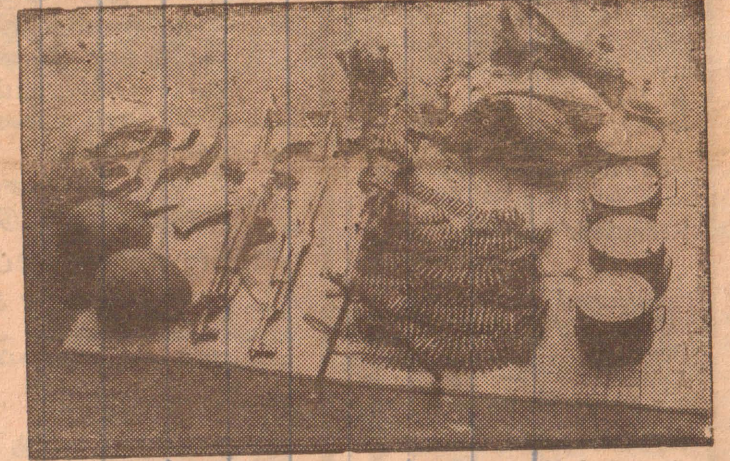
மன்னாரில் நேற்று முன்தினம் நடந்த மோதலில் விடுதலைப் புலிகளால் கைப்பற்றப்பட்ட ஆயுதங்கள்

மகனாலா மீட்டெடுக்கப்பட்டன. இவற்றில் மதனாலாவின் தலை சிதறி மூளை வெளியேறியதுடன் இடதுகை குடைக்கப்பட்டிருக்கின்றது. தாயாரின் இடுப்புக்குக் கீழ்ப்பகுதி முழுவதும் சிதறிக் காணப்பட்டது. தந்தையின் உடல் பல கறுவாசைப் பிழந்த காணப்பட்டது. மதிவாகு அருகில் பதுங்கியிருந்த மருமகனின் (4ஆம் பக்கம் பார்க்க)