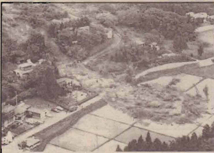
ஐப்பானின் வடகிழக்கில் சுகிடேட் நகரில் ஏற்பட்ட புவிநடுக்கத்தில் பாதிக்கப்பட்ட ஒரு பகுதி