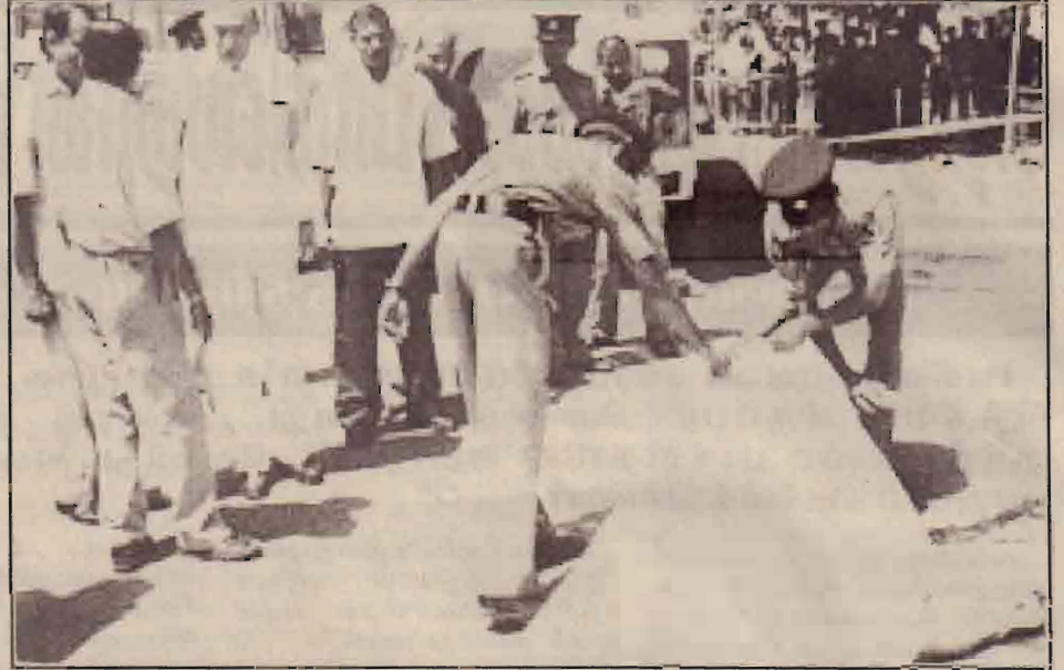
என இருப்பது அவரது குணாதிசயங்களை வெளிப்படுத்துகிறது எனலாம்.

இவ்வாறான வகையில் கடந்த சில நாட்களில் நடைபெற்ற இரு கொலைகளில் பாதாள உலகக் குழுவினர் சம்பந்தப்பட்டிருப்பதும் இதில் கொல்லப்பட்ட ஒருவர் பாதாள உலகக் குழு ஒன்றின் தலைவராக இருந்துள்ளமையும் முக்கியமான விடயங்களாகும். "மொறட்டுவ சமன்" என அழைக்கப்படும் பாதாள