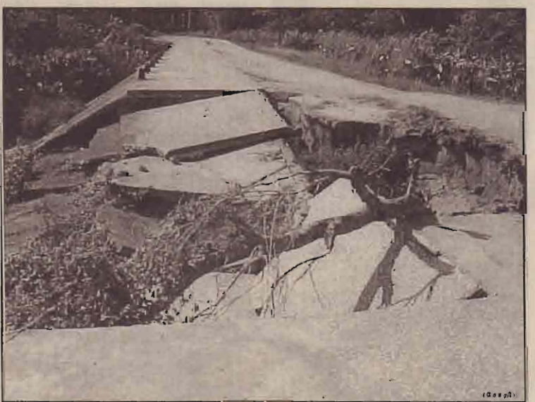
தற்போது ஏற்பட்டுள்ள இயல்பு நிலையில் சம்பந்தப்பட்ட திணைக்களங்களோ அன்றி உதவி வழங்கும் நிறுவனங்களோ முன்வந்து, இப்பாலத்தினைப் புனரமைப்புச் செய்து இப்பிரதேச மக்களின் போக்குவரத்துக்கு வழிசமைக்க மாட்டார்களாவென அக்கிராமத்து மக்கள் வினாவெழுப்பியுள்ளனர். (சேர்)

இப்பகுதியில் தென்னை வாழைப்பழிச் செய்கையினை மேற்கொண்டு வரும் விவசாயிகள் தங்கள் விளைபொருட்களை சந்தைப்படுத்துவதற்கு கந்தாரம் அல்லது கிள்ளொச்சிப் பகுதி சந்தைக்கே விற்பனை செய்வதற்கு கொண்டு செல்ல வேண்டியுள்ளது. இப்பாலம் உடைத்துள்ளதன் விளைவாக தனி நாள் வண்டிகள், அதுமட்டுமல்லாமல், நுழிச்சக்கரவண்டி, மோட்டார் சைக்கிளைத் தவிர வேறு எந்த வாகனங்களும் அவ்விதியூடாகப் பயணிக்க முடியாத நிலையில் அப்பகுதியிலிருந்து விற்பனைப் பொருட்களை எடுத்துச் செல்லும் விவசாயிகள் பல கிலோமீற்றர்களை பெரும் பணச் செலவினூடாக எடுத்துச் சென்றே விற்பனை செய்ய வேண்டிய நிலைக்கு ஆளாகியுள்ளனர்.