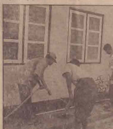
தூயவன் அரசறிவியற் கல்லூரி மாணவர்கள் நேற்று முன்தினம் கிளிநொச்சி மாவட்ட வைத்தியசாலை மற்றும் அதன் வளாகத்தில் சிரமதானப் பணியில் ஈடுபடுவதைப் படத்தில் காண்க.

கூடும் 100 பேருக்கு மேல் ஒருவருக்கு 600 ரூபா வீதம் பணம் அறவிடப்பட்டது. ஆனால் இதுவரை பரீட்சை தொடர்பான ஈந்த நடவடிக்கையும் எடுக்கப்படவில்லையென வாகன ஒட்டுனர் கவலை தெரிவித்தனர். (20)