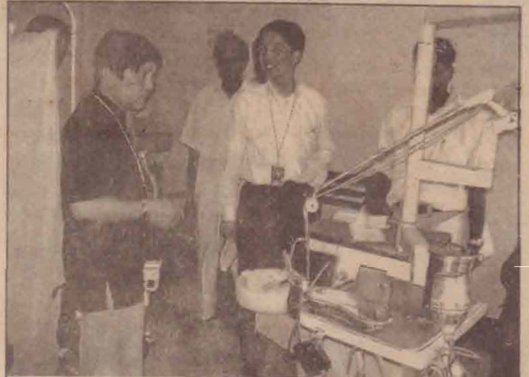
பொருளாதார ஒத்துழைப்புத் தொடர்பான ஐப்பானிய உயர் மட்டத் தூதுக் குழுவினர் நேற்று முன்தினம் கிளி.மாவட்ட வைத்தியசாலையை பார்வையிடுவதைப் படத்தில் காண்க.

வெளிநாட்டிலிருந்து வருகை தந்த பல்வேகத்தியர் முருகா மற்றும் தியாக தீயம் திலீபன் மருத்துவ சேவையினரும் தியாக தீயம் திலீபன் மருத்துவ நிலையம் ஆழியவளையில் கடந்த வியாழக்கிழமை அன்று 65 பேர்க்குப் பற்சிக்ச்சை வழங்கியுள்ளனர். இதில் பல் அடைத்தல், பல் பிடுங்குதல் என்பன இடம் பெற்றது.