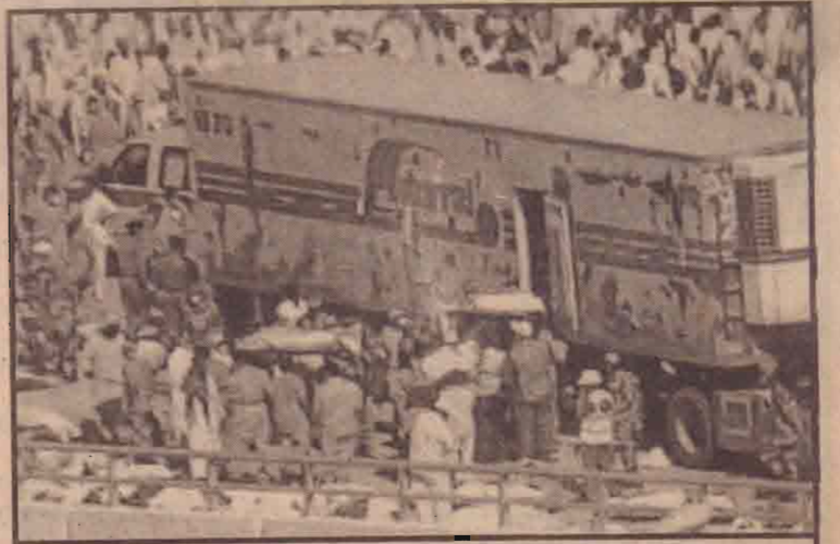
மதீனாவில் ஏற்பட்ட சனநெரிசலில் சிக்கிக் கொண்டோரை மீட்கும் பணி நடைபெறுகிறது.

யாகக் கூறமுடியவில்லை என்றாலும் சுமார் 244 பேர் காயமடைந்துள்ளதாகத் தெரிவிக்கப்படுகிறது. இறந்தவர்கள் எந்த நாட்டைச் சேர்ந்தவர் என்பது இன்னமும் உறுதியாக அடையாளம் காணப்படவில்லை என்று சவுதிஅரேபியாவின் சமய விவகாரத் துறை அமைச்சர் தெரிவித்துள்ளார்.