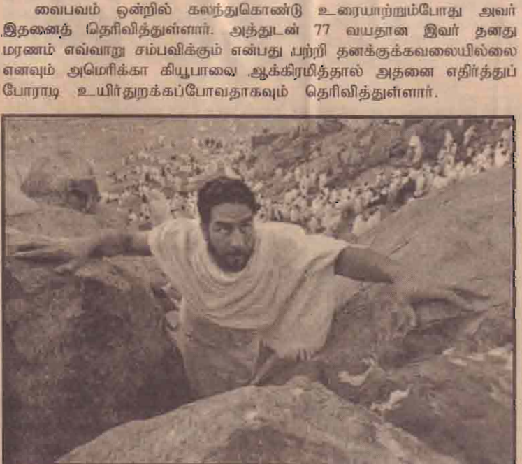
இஸ்லாமியரின் புனித ஹஜ் யாத்திரையின் ஒரு கட்டமாக அரேபியாவிலுள்ள அராபாத் மலையின் ஐபால் அல்ரமா நோக்கி யாத்திரை மேற்கொள்ளும் யாத்திரிகள்.

வைபவம் ஒன்றில் கலந்துகொண்டு உரையாற்றும்போது அவர் இதனைத் தெரிவித்துள்ளார். அத்துடன் 77 வயதான இவர் தனது மரணம் எவ்வாறு சம்பவிக்கும் என்பது பற்றி தனக்குக்கவலையில்லை எனவும் அமெரிக்கா கியூபாவை ஆக்கிரமித்தால் அதனை எதிர்த்துப் போராடி உயிர்துறக்கப்போவதாகவும் தெரிவித்துள்ளார்.