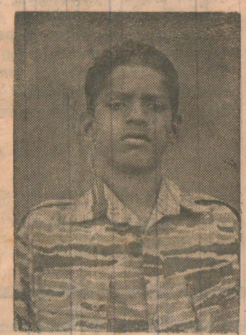
மணலாறு மாவட்டத்தில் சிறிலங்கா இராணுவத்தினருடனான நேரடி மோதலில் வீரவேங்கை சித்தன் வீரச்சாவை