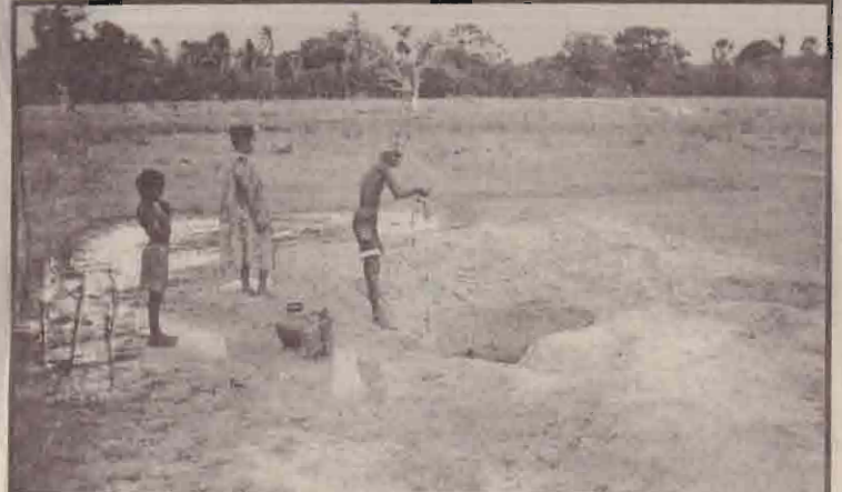
கண்டாவளைப் பிரதேச செயலர் பிரிவினாவுள் எதிர்பாரும் கிராமத்திலுள்ள சூழல்களுக்கும் வற்றிய நிலையில் குவாத்திலுள் கிணறு (பூவல்)தோண்டி மக்கள் நீரைப் பெறுவதைக் காண்க.

மேற்படி கிராமங்கள் தோறும் எழுச்சிப் பிரகடனத்திற்கான பதாதைகள் கட்டப்பட்டு பிரகடனங்கள் ஒட்டப்பட்டு கூட்டுறவாளர்கள் கருத்துக்கள் வழங்கி வருகின்றனர். இதில் பெருமளவான கூட்டுறவாளர்கள் கலந்து கொண்டுள்ளமையும் குறிப்பிடத்தக்கது. (24)