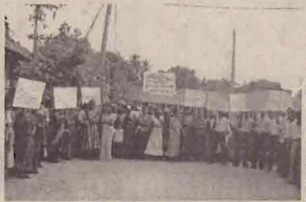
செய்யப்பட்ட முறைப்பாட்டில் தெரிவிக்கப்பட்டிருப்பதாவது;

மேலும் இது தொடர்பில் யாழ். மனித உரிமைகள் ஆணைக்குழுவிலும் முறைப்பாடு செய்யப்பட்டதுள்ளது. இது தொடர்பில்