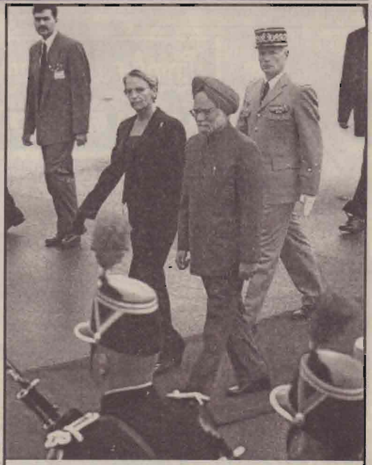
பிரான்ஸ் நாட்டிற்குச் சென்றுள்ள பிரதமர் மன்மோகன்சிங்கிற்கு, ஒர்லி விமான நிலையத்தில் அணிவகுப்பு மரியாதையுடன் வரவேற்பளிக்கப்பட்டது

நாளை அமெரிக்கா செல்ல விருக்கும் பிரதமர் சனாதிபதியையும் சந்தித்துப் பேசவுள்ளார். ஐ.நா சபையின் கூட்டத்தில் கலந்துகொள்ளும் மன்மோகன்சிங் அங்குள்ள தலைவர்களையும் சந்தித்துப் பேசவுள்ளார்.