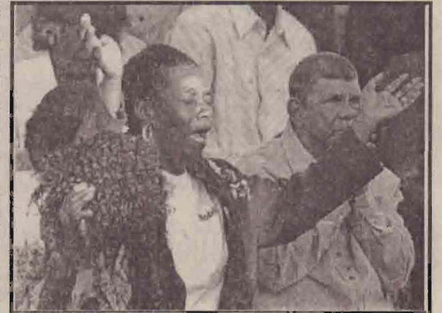
நியூயோர்க்கில் துறாவளியால் கூடம் பெயர்ந்து அதை குகாவில் சூறக்கும் பெண் ஒருவர் பிராந்தீயத்தில் ஈடுபட்டுள்ளார்.

ஹமாஸ் மீதே அல்லது பிற அமைப்புக்கள் மீதே நடவடிக்கை எடுக்க நாங்கள் தயாராக இல்லை. காஸா பகுதியில் இந்த அமைப்புக்கள் பலத்தடன் உள்ளன. தற்போதைய நிலையில் அந்த அமைப்புக்களுடன் மோத தயாராக இல்லை உள் நாட்டுக் குழப்பத்தை ஏற்படுத்த நாங்கள் விரும்பவில்லை என்றார் அப்பாஸ்.