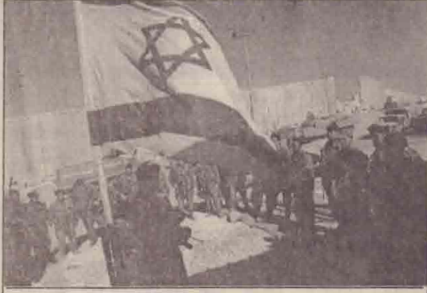
38 வகுடங்களின் பின்னர் காஸாவின் எகிப்து எல்லைப்பெயர்ந்து இஸ்ரேலிய துருப்பினர் வெளியேறத் தயாரான நிலையில் அவர்களின் தேசியக் கொடி சூறக்கப்படுவதை படத்தில் காணலாம்.