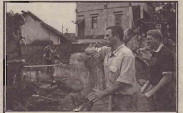
கடந்த எட்டாம் திகதி காபாத்திராவில் மொதாஸில் பயணத்தை ஆரம்பித்த சிறுநூலத்தில் விபத்துக்குள்ளான மண்டோலா விமான சேவையின் போயிங் 737-250 ரக விமானத்தின் சீதைவுகளைத் தேடும் பணியில் ஈடுபட்டுள்ள தேடுதல் பணியாளர்கள் சம்பவத்தில் 102 பயணிகள் பலியானார்கள்.

அமெரிக்காவில்கடந்த மாதம் 29ஆம் திகதி கற்றிணா சூறாவளி வீசிய போது பெய் மழை பெய்தது. 230.கி.மீ., வேகத்தில் சூறாவளி வீசியதில் மிசிசிப்பி, லூசிபானா, அலாபாமா மாகாணங்கள் பாதிக்கப்பட்டன. லூசிபானாவில் மிக மோசமாக பாதிக்கப்பட்ட நியூஓர்லியன்ஸ் நகரின் 80 சதவீத பகுதி தண்ணீரில் மூழ்கிவிட்டது. மொத்த தண்ணீரையும் வெளியேற்ற 80 நாட்களாகும் என பொறியியலாளர் தெரிவித்தனர். தற்போது தண்ணீர் வேகமாக வடிந்து வருவதால் ஒக்ரோபர் 18ஆம் திகதிக்குள் பல அடி உயரம்தேங்கிநிற்கும் தண்ணீர் வெளியேற்றப்படும் என்று பொறியியலாளர்கள் தெரிவித்தனர்.