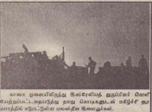
காஸா முகாமில் இருந்து இஸ்ரேலியத் துருப்பினர் வெளியேற்றப்பட்டதையடுத்து தமது கொடிகளுடன் மகிழ்ச்சி ஆர்வாரத்தில் ஈடுபட்டுள்ள பலஸ்தீன இளைஞர்கள்.