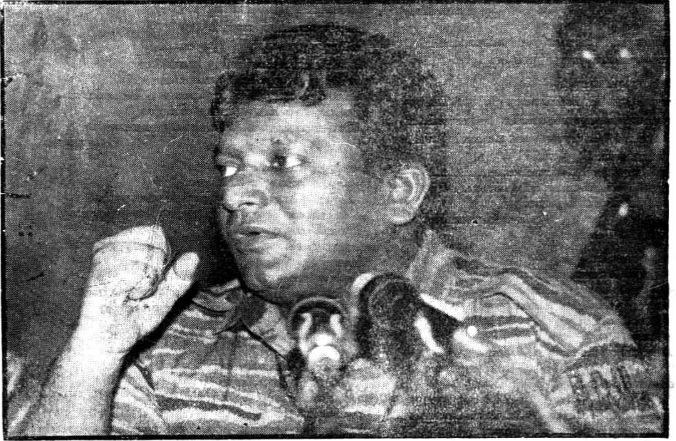
குறைந்த வளங்களை வைத்துக்கொண்டு அதிஉச்ச பயணங்கள் ஒரு மேய் 5

ஜயசிக்குறையின் இராணுவ இலக்கை எய்துவதற்கு எதுவுமே தடையாக இருக்கமாட்டாதென்றே - சிங்களத்தளபதிகள் - இறுமாந்திருந்தனர்.