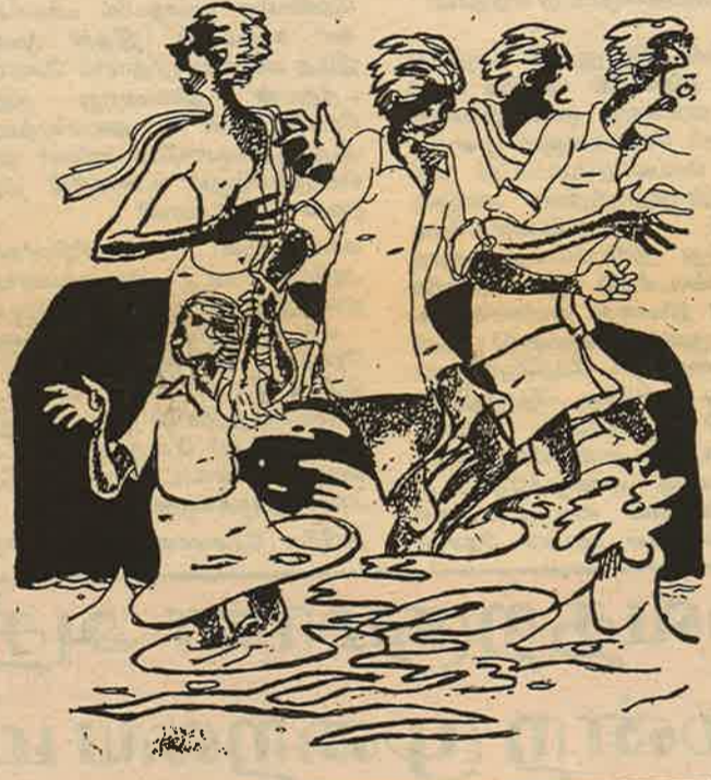
ஆறு ஆழமில்லாமல் இருந்தது - கோபமில்லாமல் அமைதியாக ஓடியது. "சீ..... இந்த ஆறு அண்டைக்கும் இப்பிடியே ஓடியிருந்தால்... .. அந்த நினைவு நெஞ்சை பரமமாக அழுத்தியது.

"ஆயிக்காரர் வாறாங்கள்" அவர்கள் தொடர்ந்தும் ஓடினார்கள்.