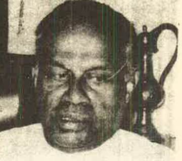
கடிதங்கள் மூலம் பேச முடியாது.

இந்த யோசனைகளில் 'மாகாண அரசு' என்ற சொற்பிரயோகம் கையாளப்பட்டிருந்ததே தவிர தமிழர் தாயகத்தின் பிரதேச அந்தஸ்து, சுயாட்சி உரிமை, ஆட்சி அதிகாரம் எதுவும் பற்றி தெளிவான விளக்கமோ வரையறைகளோ இருக்கவில்லை. ஒரு சில திருத்தங்கள் செய்யப்பட்ட பழைய மாகாணசபைத் திட்டத்தின் அடிப்படைகளைக் கொண்டது போல இந்த யோசனைகள் அமைந்திருந்தன. இது எமக்கு ஏமாற்றத்தைக் கொடுத்தது.