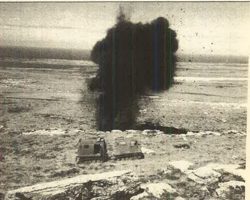
ஆழமான கிணறுகளிலிருந்து பெற்றுக்கொள்ள வேண்டும்.

பாரசீக வளைகுடாப் போர் ஓய்ந்துவிட்டது. ஆனால் அங்கு மழை விட்டும் தூவானம் ஓய்ந்த பாடில்லை. ஈராக்கில் உள்நாட்டுக் கலகம் வெடித்துள்ளது. ஈராக் - ஈரானுக்கிடையில் கெடுபிடி யுத் தம் (Cold war) நடைபெறுகிறது. அமெரிக்கா தனது ஏகாதிபத்திய நலன்களைப் பாதுகாக்கப் பகிர தப்பிரயத்தனம் செய்து வருகிறது.