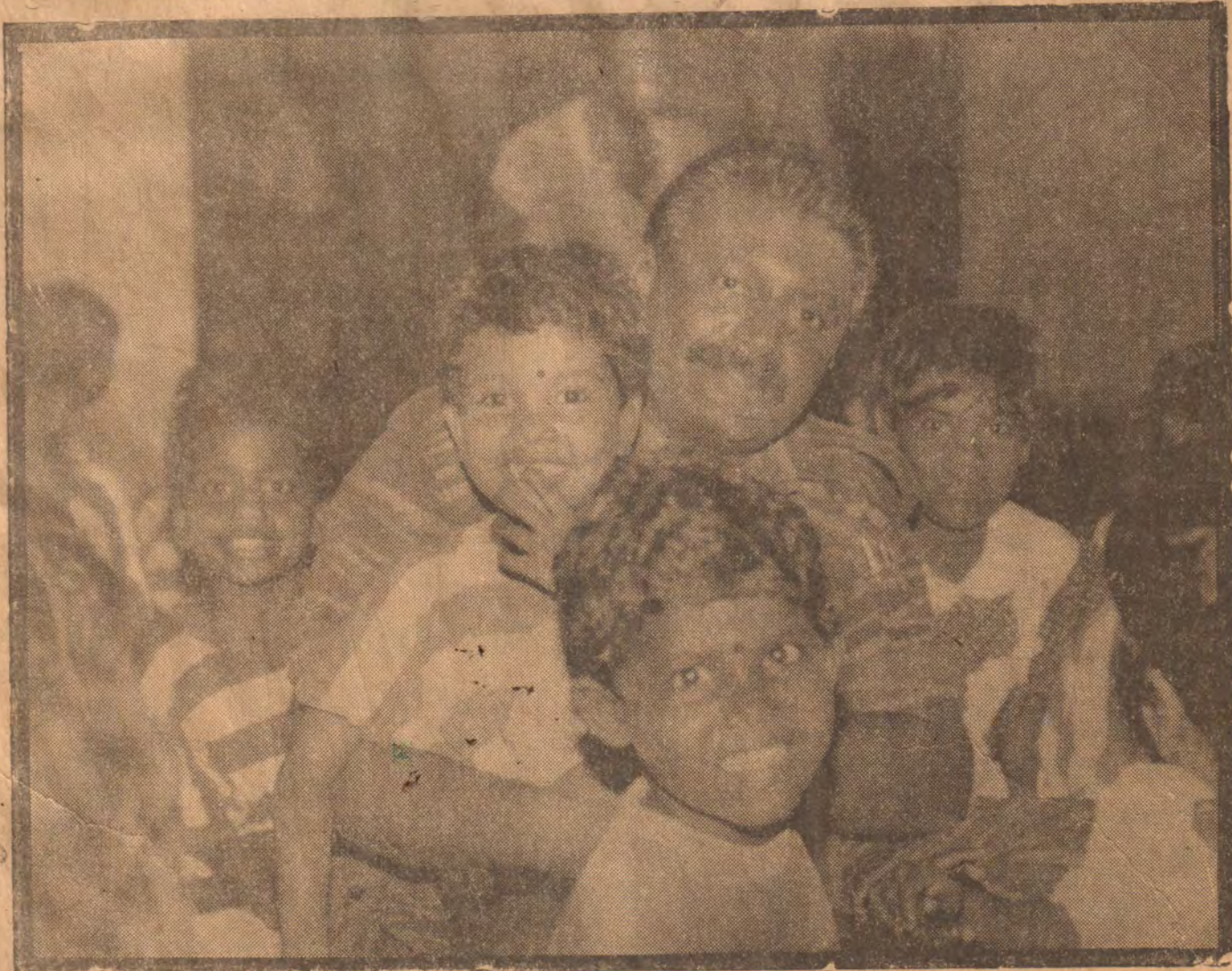
தலைவரின் அணைப்பில் பிஞ்சுகள்

பெண்களுக்கு சமத்துவமும், சமஉரிமையும் மற்றும் அடிப்படையான மனித சுதந்திரங்களும் வழங்குவதற்கு சகல அரசுகளும் நடவடிக்கைகளை மேற்கொள்ளவேண்டும் என்றும், ஐ. நா சிறுவனங்களும் சர்வதேச ரீதியான அவற்றின் செயற்பாடுகளும் பெண் உரிமைக்கு முன்னுரிமை கொடுக்க (2 ம் பக்கம் பார்க்க)