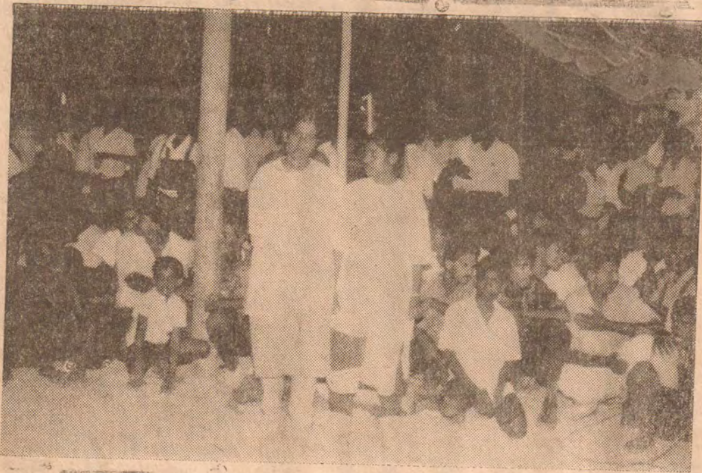
மக்களின் நடுவே யமுனாவும் மாலாவும்

தமிழீழத்தின் முதலாவது அதி பாரந்தாங்கும் வீராங்கனைகள் இம் மாத நடுப் பகுதியில் தமது முதலாவது சாதனையை நிலை நாட்டினார்கள்.