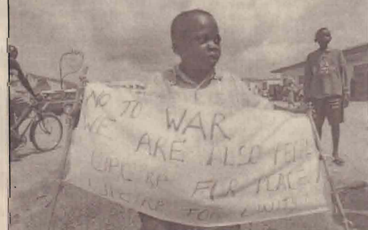
ஐக்கிய நாடுகளின் பாதுகாப்புச்சபை ராஜதந்திரிகளை வரவேற்கு திரண்டிருக்கும் மக்களிடையே "புத்தம் வேண்டாம்" என்ற சலோகத்துடன் காணப்படும் கொங்கோலியச் சிறுவர்.

(பாக்தாத்) ஈராக்கின் வட பகுதியிலுள்ள குர்திஸ் கட்சிகள் அரசியல் நடவடிக்கைகளில் இணைந்து செயற்பட தீர்மானித்துள்ளனர். குர்திஸ்தான் சனநாயகக் கட்சி, குர்திஸ்தான் தேசவிமான யூனியன் என்பன இவ்வாறு இணைந்து கொள்ளவுள்ள கட்சிகளாகும். ஈராக்கின் வடபகுதி நகரத்தில் நடைபெற்ற கூட்டத்தின் போது இரு கட்சிகளின் தலைவர்களும் சேர்ந்து இத்தீர்மானத்தை பேரறிவுகொண்டுள்ளனர். வடபகுதி மலைப்பிரதேசம் இவர்களது கட்டுப்பாட்டில் உள்ளது. துருக்கிய அதிகாரிகள் கருத்துத் தெரிவிக்கையில் குர்திஸ் கட்சிகள் ஒன்றிணைவதன் மூலம் எதிர்க்கட்சியில் தனி இராச்சியம் கேட்கப்படலாம் என அச்சம் வெளியிட உள்ளார்.