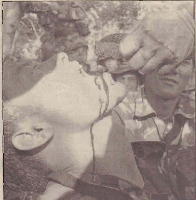
மேற்கு பாலாவில் மலைப்பகுதியில் பத்திரிகை நீருபர் ஒருவர் பண்பீன் இரத்தத்தை குடிக்கின்றார்.

தும் தலைநகர் கவானாவில் பல்லாயிரக்கணக்கான மக்கள் கலந்து கொண்டு கண்டன பேரணி நடத்தியுள்ளார்கள். இதில் கியூபா சனாதிபதி காஸ்ரோ உள்ளிட்ட முக்கிய பிரமுகர்களும் கலந்து கொண்டுள்ளார்கள். தங்கள் நாட்டின் மீதான தடைகளை விலக்கிக் கொள்ளாது விட்டால் தாங்களும் கரும் நடவடிக்கைகளை மேற்கொள்ள வேண்டியிருக்கும் என கியூபா தலைவர்கள் எச்சரிக்கை செய்துள்ளார்கள்.