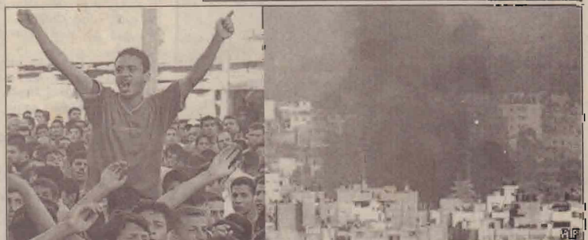
காசா முனையில் இஸ்ரேலியப் படைவீன் உலங்கு வானூர்தி நடத்திய தாக்குதலும் அதனைக் கண்டித்து ஆர்ப்பாட்டம் நடத்தும் பலஸ்தீன் ஹமாஸ் ஆதரவாளர்களும்.