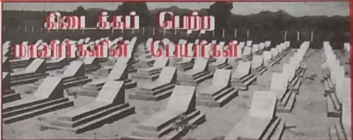
கிடைக்கப் பெற்ற மரணிகளின் பெயர்கள்

2.2.2000 வள்ளி பாலமோட்டைப் பகுதியில் சிந்லங்காப்படையினருடனான மோதலின்போது பெண்போராளியொருவர் வீச்சாவடைந்தார்.