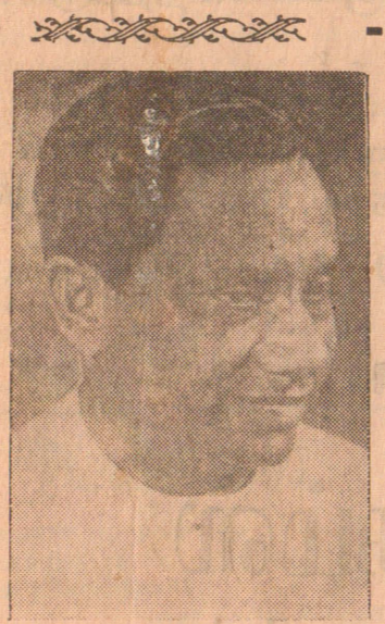
தயார நிலையம் இருந்ததாக பண்டாரகம மகாவித்தியாலயத்தில் நிகழ்ந்த மகாபொல ஒன்பதாவது

கடந்த சில நாட்களாக இவற்றுக்கு போதிய பால் கிடைக்காததால் வடிக்கையாளர் ஏமாற்றத்துடன் செல்வதாகவும் விற்பனையாளர் தெரிவிக்கின்றனர். (6ஆம் பக்கம் பார்க்க)