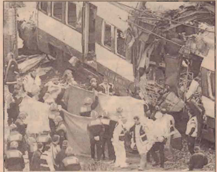
ஸ்பெயினின் நீதித்துறை நிபுணர்கள் புகையிரத குண்டு வெடிப்பில் கொல்லப்பட்டவர்களது சடலங்களைப் பார்வையிடுகின்றனர்.

இதேவேளை இத்தாக்குதலைக் கண்டித்து ஆயிரக்கணக்கானோர் போராட்டங்கள் நடத்தி வருகின்றனர்.