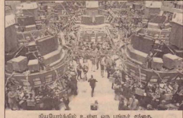
நியூயோர்க்கில் உள்ள ஒரு பங்குச் சந்தை.

எதிராக எதிரி நாடுகளும் பஸ்தேசிய கம்பனிகளும் சதிமுயற்சியை மேற்கொண்டு வருவதாக அந்த நாடு குற்றம்சாட்டிவருகிறது.