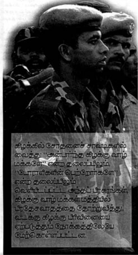
கிழக்கில் சோதனைச் சாவடிகளில் வைத்து "அன்பாற்ற கிழக்கு வாழ மக்களே" என்ற தலைப்பிலும் "போராளிகளின் பெற்றோர்களே" என்ற தலைப்பிலும் வெளியிடப்பட்ட அந்தப் பிரசாரங்கள், கிழக்கு வாழ மக்கள் மத்தியில் பிரதேசவாதத்தை தோற்றுவித்து, வடக்கு கிழக்கு பிரிவினையை ஏற்படுத்தும் நோக்கத்திலேயே மேற்கொள்ளப்பட்டன.

தமிழ்பேகம் சமூகம் என்கின்ற இன அடையாளத்தில் இருந்து முஸ்லிம்களைப் பிரிப்பதற்கு ஸ்ரீலங்கா அரசு மேற்கொண்ட பல தகிடு தத்தங்களில், தமிழ் இளைஞர்களுக்கு எதிராக அட்டுழியங்களை முஸ்லிம் அரசியல்வாதிகளையும், முஸ்லிம் பெயர்களை உடைய இராணுவ அதிகாரிகளையும் முன்வைத்தே மேற்கொண்டது தான், அதன் ஒரு வகையிலான வெற்றிகளுக்கு காரணமாக அமைந்ததாக ஆய்வாளர்களால் கட்டிக் காண்பிக்கப்படுகின்றது.