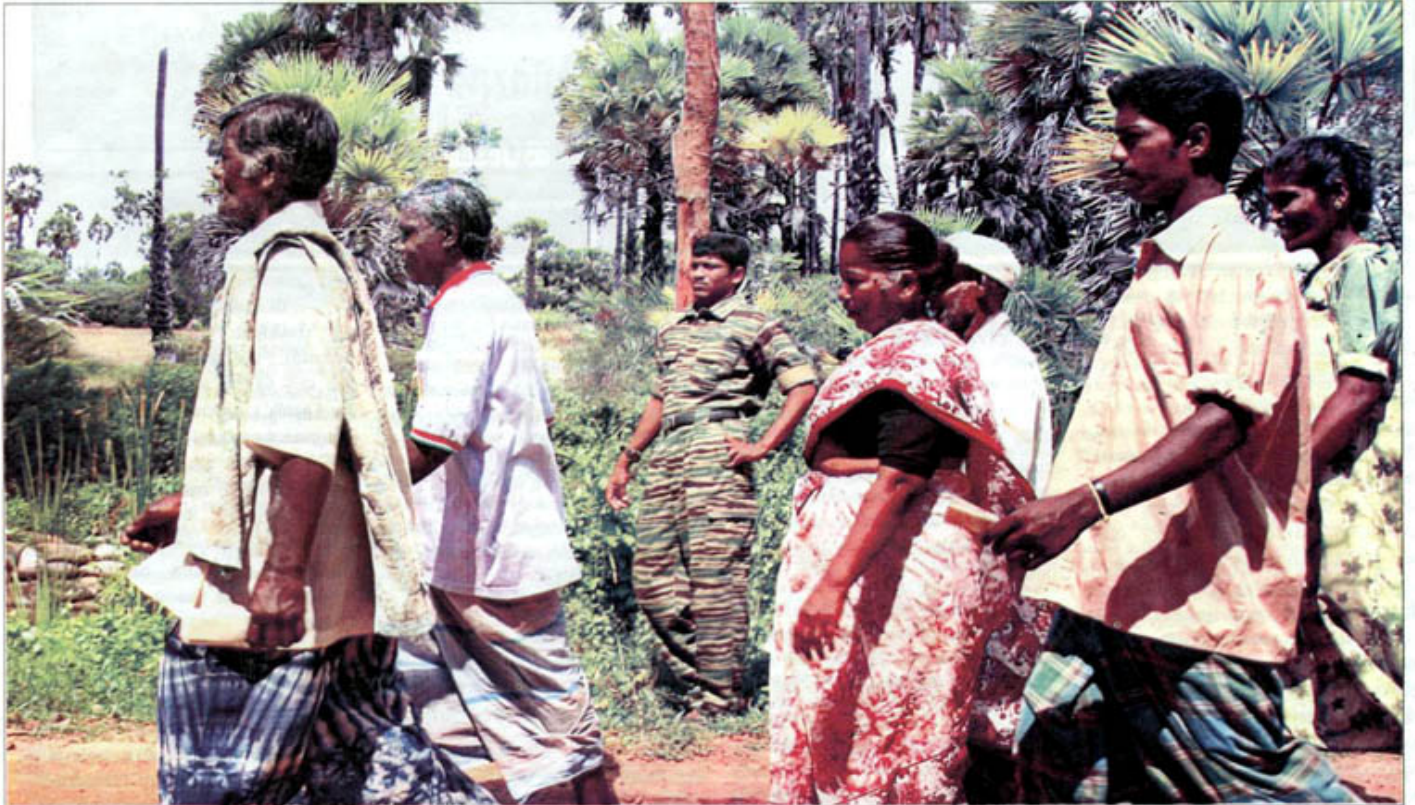
படைநடத்திப் பெற்ற வெற்றிப் பெரு உயர்வில் மடைதிறந்து வந்த அமைதிப்பயிர் விளைவின் அறுவடைக்காய்...

கருணாவின் கட்டுப்பாட்டில் இருந்த பல்லாயிரம் போராளிகளுக்கும் - இந்தத் துரோகச் செயலுக்கும் எந்தவித (தொடர்ச்சி 02ம் பக்கம்)