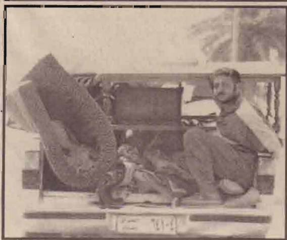
வாகனத்தில் பொருட்களை ஏற்றிச் செல்லும் ஈராக்கியர்