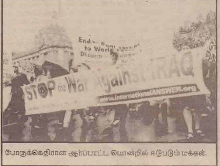
போருக்கெதிரான ஆர்ப்பாட்ட மொன்றில் ஈடுபடும் மக்கள்.

அத்தோடு சிரியா, வடகொரியா, ஈரான் மற்றும் கீனா போன்ற நாடுகள் ஏவுகணைகளை தயாரித்து வருவதாக சி.ஐ.ஏ. தனது அறிக்கையில் சுட்டிக்காட்டியுள்ளது.