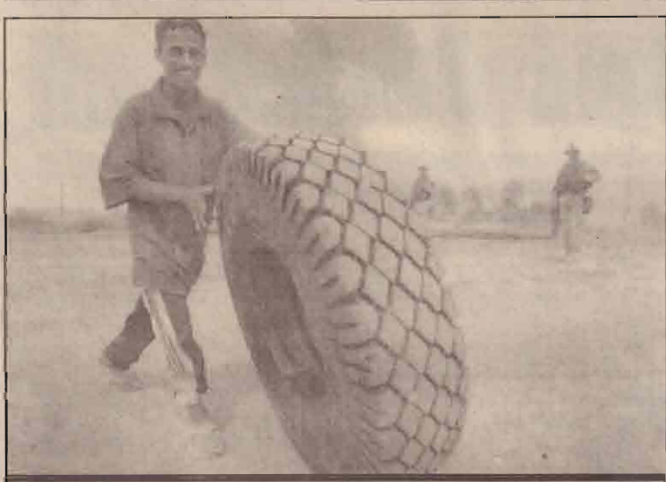
பாக்கத்தலில் வாகன ரயர் ஒன்றை கொள்ளையிட்டு உருட்டிச் செல்லும் ஈராக்கிய பொதுமகன்.