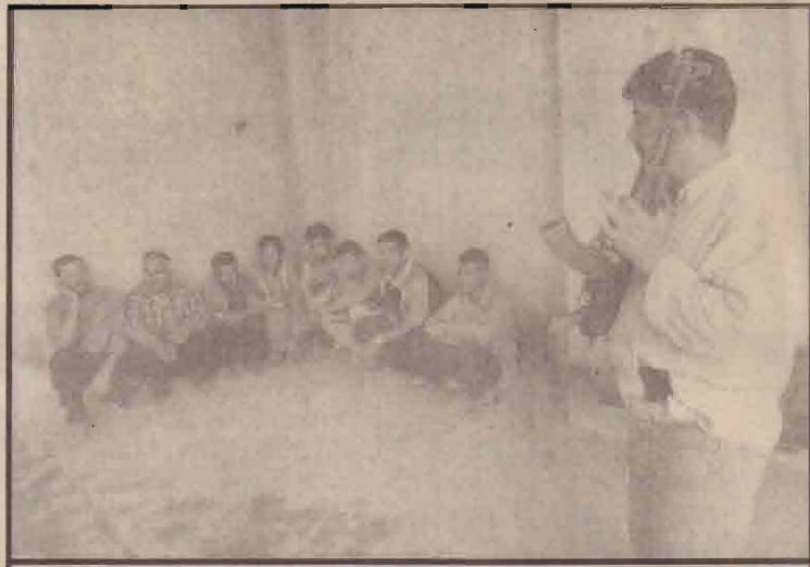
பாக்கத்தலில் உள்ளூர் நகர வாசிகள் கொள்ளையர்கள் சிலரை ஆயுத முனையில் பிடித்து வைத்துள்ளனர்.

பாகிஸ்தான் அணுவாயுத பரவலில் ஈடுபட்டுள்ளது என்றும் அண்மையில் வடகொரியாவிற்கு ஏவுகணைச் சாதனங்களை வழங்கியதற்காக பாகிஸ்தானின் ஆராய்ச்சி நிறுவனம் மீது அமெரிக்கா தடை விதித்திருப்பது இதற்கு தகுந்த ஆதாரம் என்றும் அவர் குறிப்பிட்டார்.