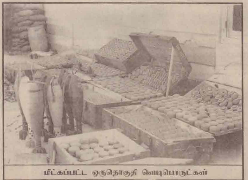
மீட்கப்பட்ட ஒருநொகுதி வெடிபொருட்கள்

கடந்தகாலப் பணியின்போது ஏற்பட்ட விபத்துக்களில்