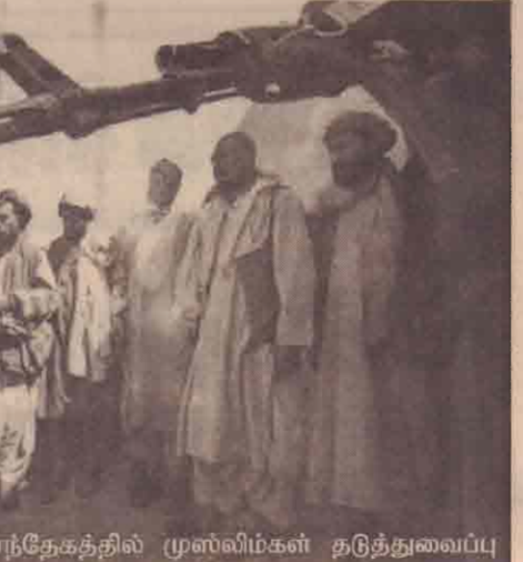
சந்தேகத்தில் முஸ்லிம்கள் தடுத்துவைப்பு

ஏற்கனவே, ஐ.நா. சபையின் அனுமதியை துச்சமென மதித்து, சராக் மீது போர் தொடுத்த பெருமை புஷ்விற்கும், ரொனிப் பிளேயருக்குமே சேரவேண்டியது.