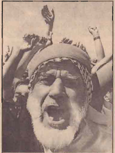
பாக்தாத்தில் உம்ரோ பள்ளி வாசலுக்கருகில் அமெரிக்க எதிர்ப்பு கோசங்களை நடத்தும் ஈராக்கியர்.

தமிழ் நாட்டில் பொடோ சட்டம் எவ்வாறு துவ்ரீர் போகும் செய்யப்பட்டது என்பதற்கு வைகோவின் வழக்கு ஒர் உதாரணமாகுமென காங்கிரஸ் கட்சியின் மாநில தலைவர் வாசன் வெளியிட்டுள்ள அறிக்கையில் இதனைத் தெரிவித்துள்ளார். அத்துடன் பொடோ சட்டத்தை முற்றிலும் தீரும்பெற வேண்டுமென காங்கிரஸ்கட்சி வலியுறுத்தி வருவதாக அவர் மேலும் குறிப்பிட்டுள்ளார். நடைபெறுவள்ள இந்திய மக்களவை தேர்தலில் காங்கிரஸ் கட்சியுடன் ம.தி.மு.க கூட்டணி அமைத்துள்ளமை குறிப்பிடத்தக்கது.