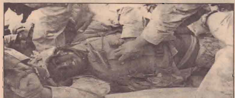
பாலூஜாவில் நடைபெற்ற சண்டையில் காயங்களுக்குள்ளான அமெரிக்கப் படையினருக்கு முதலுதவி அளிக்கப்படுகிறது.