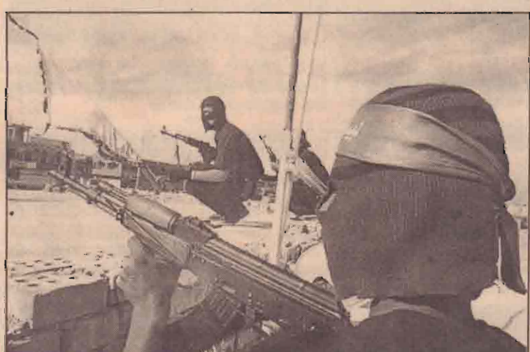
பாக்தாத்துக்கு அண்மையில் சதர் நகரில் அமெரிக்கத் துருப்புக்களோடு சண்டையிடும் மக்டடா சதர் போராளிகள் கூரையீது நிலையெடுத்து நிற்கின்றனர்.