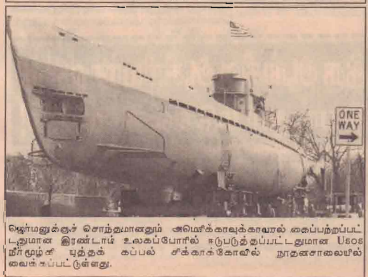
ஜெர்மனுக்குச் சொந்தமானதும் அமெரிக்காவுக்காவால் கைப்பற்றப்பட்டதுமான இரண்டாம் உலகப்போரில் ஈடுபடுத்தப்பட்டதுமான USS நீர்மூழ்கி புத்தக கப்பல் சக்காக்கோவில் நூதனசாலையில் வைக்கப்பட்டுள்ளது.