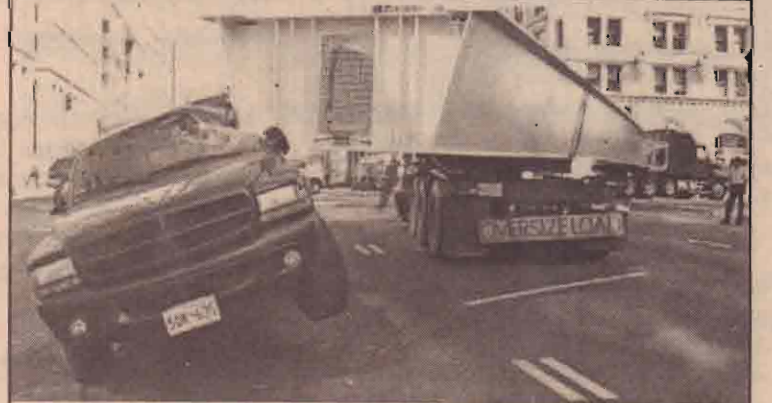
வாஷிங்டனில் 37.5 தொன் எடையுள்ள தூண் ஒன்றை ஏற்றிச் சென்ற கனரகவாகனம் ஒன்றால் மோதப்பட்ட கார் பாதையை வீட்டு விலகியிருப்பதை காணலாம்.

பாகிஸ்தானிலிருந்து வரக்கூடிய அச்சுறுத்தல்களையும், இந்தியாவுக்கெதிரான தீவிரவாத வன்முறைகளையும் மிகவும் உறுதியுடன் சமாளிக்கும் என்று காங்கிரஸ் கட்சி தமது தொலைநோக்கு அறிக்கையில் திட்டவாட்டமாக அறிவித்துள்ளது.