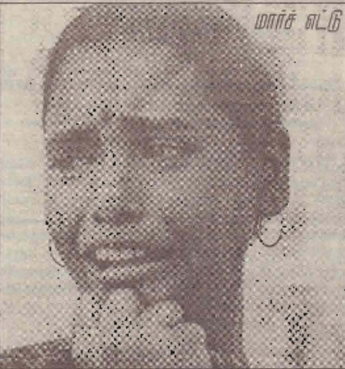
தன் கணவனை செம்மணியில் தேடும் தமிழ்ப்பெண்