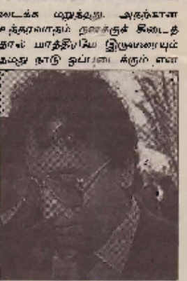
லொக்கம்பி விவகாரத் தகர்ப்பு சத்தேக நபர்கள்

சர்க்கர் முன்விவாதத்தில் இருவரும் விசாரணைக்காக தீறுத்தப்பட்டு லிபியா ஒத்துக்கொண்டதால் இருவரும் நெகர்லாந்தில் தற்கியிருக்கும்போதான பிரித்தானிய அபிவிக்க அதிகாரிகளிடம் விசாரணை செய்யப்பட்ட கூடாது என்றும் சில வேளை இருவரும் அமெரிக்காவுக்கோ, பிரித்தானியாவுக்கோ கடந்தபடலாம் என்றும் கூறிய லிபியா இருவரையும் ஒப்ப