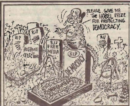
தமிழ்: THE SUNDAY LEADER

மரபுத்தே, புலம்பெயரும் தமிழ் மக்கள் மீது தனது வதைக்கரங்களை இறுக்கிய சிறிலங்கா அரசு தனது குடிவரவு-குடியகல்வு உட்பத்தில் நிரந்தரத்தினை மேற்கொண்டு அவர்களைச் சிறைகளில் தள்ளிபுள்ளது. தமிழர்கள் சட்டவிரோதமாக வெளிப்பேறி தனது நாட்டுக்கு அபகீர்த்தியை ஏற்படுத்துகிறார்கள் என்பதே சிறிலங்கா தரப்பின் வாதமாகும். 'செர்மன்ஸ் புலககுழி' போன்ற புறவ ஐனநாயக சிறப்புக்களைக் கொள்ள சிறிலங்கா அரசு உயிருக்கு அஞ்சி ஓடும் தமிழ் மக்கள் மீது தனது விவகாரத்தைக்காட்ட முனைந்துள்ளமை அப்பட்டமான அதன் பேரினவாதப் போக்கினை தவிர வேறொன்றுமில்லை. எவ்வதான் திருத்தச் சட்டங்கள் செய்தாலும் அது தமிழ் தேசியத்திற்கு எதிராகத்தான் அதனை மேற்கொள்ளும் என்பதற்கு இந்த விடயமும் ஒரு எடுத்துக்காட்டாகும். ஆனால் இதனை ஐனநாயக நாடுகள் என தம்மைக் கூறிக்கொள்ளும் நாடுகள் உணர்ந்து கொள்ளுமா?