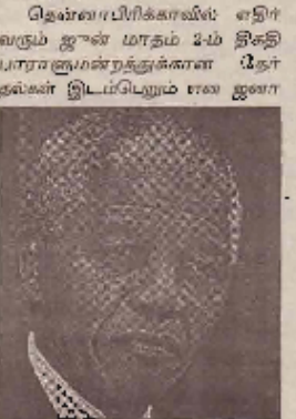
நிபதி தெர்தல் மண்டேலா கடந்த புதன்ன்று அறிவித்தார்

தெர்தல் 88 விகித வாக்குகளை ஆபிரிக்க தேசிய காங்கிரஸ் பெற்று பெரு வெற்றியைப் பெற்றிருந்தது. ஆனால் தற்போதைய ஊழல் புகர்கள் 53-55 விகித வாக்குக்களையே ஆபிரிக்க தேசிய காங்கிரஸ் பெற்றுக்கொள்ளும் எனக் கூறுகிறது. இந்த வாக்கு விநிதம் நாட்டின் அரசியல் சட்டத்தில் திருத்தங்களைக்கொண்டு வரப்போதுமானதாக இருக்காது என அரசியல் அவதானிகள் கூறுகின்றனர். தென்னாபிரிக்காவில் நிலப்பயிற்சி மத்திய அரசின் அதிகாரம் போன்றவற்றின் மாற்றங்களைக்கொண்டு வருவதையும் தற்போதைய அரசிற்கு இது ஏமாற்றமாக அமைக்கும் என மேலும் அவர்கள் கூறுகின்றனர்.