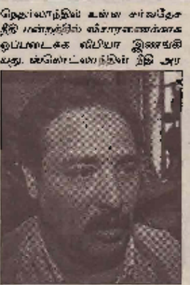
லொக்கம்பி விவகாரத் தகர்ப்பு சத்தேக நபர்கள்

05.03.99 லிபியத் தலைவர் முகாபர் கடாபி அவர்கள் அகாச விஜயம் ஒன்றை மேல்சென்று எகிப்துக்கு வந்து சென்றார். 1988-ம் ஆண்டு ஸ்கொட்லாந்தின் லொக்கம்பி நகருக்கு மோலாக பலரம் விவகார தீவிரத்தின் விளைவாக குண்டு வெத்துத் தாக்கப்பட்ட சம்பவத்தின் குத்திரதாரிகள் என குற்றம் சாட்டப்பட்டிருக்கின்ற லிபிய உளவுத்துறையினரை மேலதிக விசாரணைகளுக்காக ஒப்படைப்பது பற்றிய ஆலோசனைகளை எகிப்து அகாச நேராவளி முயார்க்குடல் பகிர்ந்துகொள்வதற்காகவே, லிபியத் தலைவர் எகிப்து வந்து சென்றார். லிபியத் தலைவருடன் பல அரசு அமைச்சர்கள் மற்றும் லிபிய வந்தக பிரதானிகளும் எகிப்துக்கு வந்து சென்றனர். லிபியாவில் விவகாரங்கள், இறங்குவோர் அங்கு குடிபுகுவோர் வெவ்வேறான தடை விதிக்கப்பட்டிருக்கின்ற நிலையில் லிபிய வாசகத் தொடரில் தீவிரம் தரைவழியாக கடாபிக்கு குடிபுகுனர் எகிப்து எல்லைவரைக் கடந்தனர். லொக்கம்பியில் சந்தேக நபர்களை விசாரணைகளுக்காகக் கொண்டுவருவதில் மேற்கு துடுக்குக்கும் லிபியாவுக்கும் இடையே பல வருடங்களாக இழுமறிக்க இருந்து வந்தன. இந் நிலையில் கடந்த ஒகஸ்ட் மாதம் இரண்டாம்