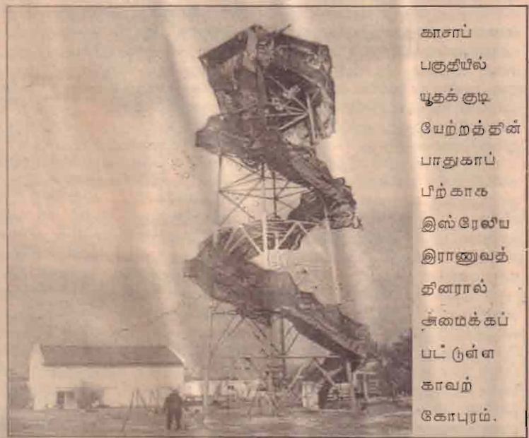
காசாப் பகுதியில் யூதக் குடி யேற்றத்தின் பாதுகாப்பு பிற்காக இஸ்ரேலிய இராணுவத்தினரால் சுமைக்கப்பட்டுள்ள காவற் கோபுரம்.

இதே வேளை சிம்பாவேயில் தென்பகுதி மாவட்டத்தில் கடந்த திங்கள், செவ்வாய்க் கிழமைகளில் நடைபெற்ற இடைத்தேர்தலில் முகாவேயின் கட்சி வெற்றி பெற்றுள்ளமை குறிப்பிடத் தக்கது.