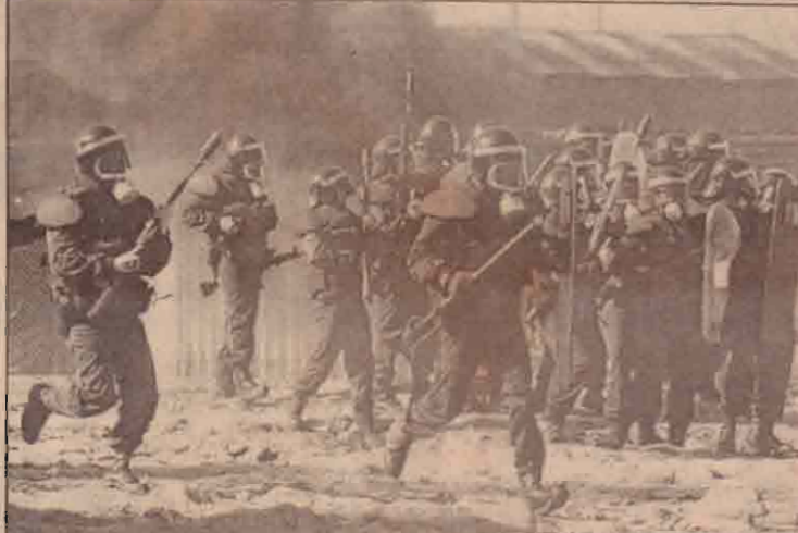
பணி நிறுத்தப் போராட்டத்தில் ஈடுபட்டுள்ள ஸ்பெயின் கப்பல் கட்டும் தொழிலாளர்களை அடக்க முற்படும் அந்நாட்டுக் கலகமடக்கும் பொலீசார்.

பூமியதிர்ச்சியால் 22 பேர் உயிரிழப்பு இந்தோனேசியாவில் பப்புவா மார்திஸ்தில் ஏற்பட்ட பூமியதிர்ச்சியில் 22 பேர் உயிரிழந்துள்ளனர். பூமியதிர்ச்சி ரிப்டர் அளவில் 6.9 என பதிவாகியுள்ளது.