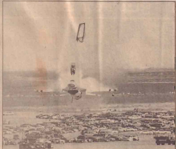
அமெரிக்காவில் "இதாக்கோ" வீமானப் படைத் தளத்தில் கடந்த வருடம் சாகஸ செயலில் ஈடுபட்டவர்களை விபத்துக்குள்ளான அமெரிக்காவின் "தண்டர் பேர்ட்ஸ்" வீமானம் இது நிலத்தில் மோத ஒரு வீநாடிக்கு முன்பு வீமானியை வெளியில் தூக்கி வீசியது.

பூமியதிர்ச்சியால் 22 பேர் உயிரிழப்பு இந்தோனேசியாவில் பப்புவா மார்திஸ்தில் ஏற்பட்ட பூமியதிர்ச்சியில் 22 பேர் உயிரிழந்துள்ளனர். பூமியதிர்ச்சி ரிப்டர் அளவில் 6.9 என பதிவாகியுள்ளது.