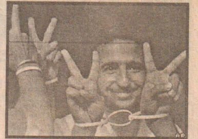
ஆனால் சிறையிலுள்ள ஏனைய ஆயிரக் கணக் கானோரும் விடுவிக்கப்படவேண்டும் எனவும் கூறினார்.

தடுத்து வைக்கப்பட 398 பேர் நேற்று முன்தினம் இஸ்ரேலால் விடுதலை செய்யப்பட்டு பேருந்து மூலம் மேற்குக்கரை, காசாப் பகுதிக்கும் கொண்டு செல்லப்பட்டனர். அப்பொழுது அவர்கள் பலஸ்தீனியத்திற்குள் நுழைந்ததும் வெற்றி அடையாளம் காட்டி மகிழ்ச்சியை வெளிப்படுத்தினர். விடுவிக்கப்பட்ட ஒருவர் நமல்லா சோதனை சாவுடியருகில் வைத்து செய்தியாளருக்குக் கூறுகையில், நான் விடுவிக்கப்பட்டதில் சந்தோசமடைகின்றேன்.