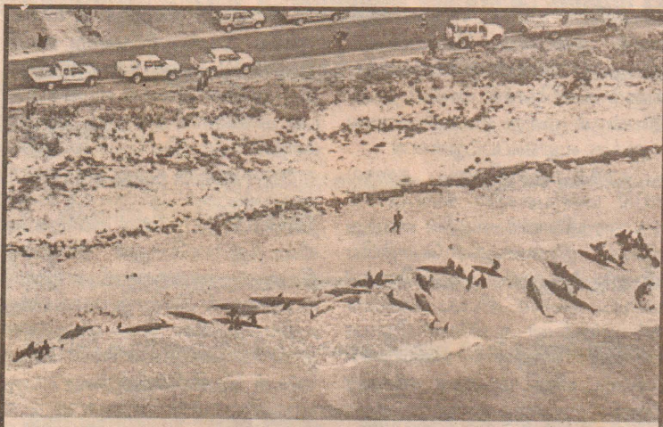
அவுஸ்திரேலியாவிலுள்ள புஸெஸ்டன் தீவில் 85இற்கும் மேற்பட்ட திமிங்கிலங்கள் கரை ஓதுங்கின. இவற்றை அங்குள்ள ஏராளமான சமூக ஆர்வலர்கள் மீண்டும் கடலுக்குள் கொண்டு செல்ல முயற்சி எடுத்தனர். இதனால் 20இற்கும் மேற்பட்ட திமிங்கிலங்கள் மீண்டும் கடலுக்குள் உயிருடன் அனுப்பி வைக்கப்பட்டன.