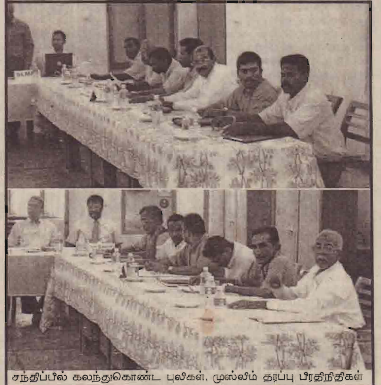
சந்திப்பில் கலந்துகொண்ட புலிகள், முஸ்லிம் தரப்பு பிரதிநிதிகள்

இக்கூட்டத்தில் குறிப்பாக புலிகளின் கட்டுப்பாட்டுப் பிரதேசத்தில் முஸ்லிம்கள் விவசாயச் செய்கையில் ஈடுபட்டிருப்பது தொடர்பாக ஏற்பட்டுள்ள முன்னேற்றங்களுடன் அரசு கட்டுப்பாட்டுப் பிரதேசங்களில் விசேடமாகத் தமிழர்களுக்குச் சொந்தமான காணிகளில் இடம்பெற்ற அத்துமீறல்கள் குறித்தும் கவனம் செலுத்தப்பட்டு ஆராயப்பட்டதாகத் தெரிவிக்கப்பட்டுள்ளது.