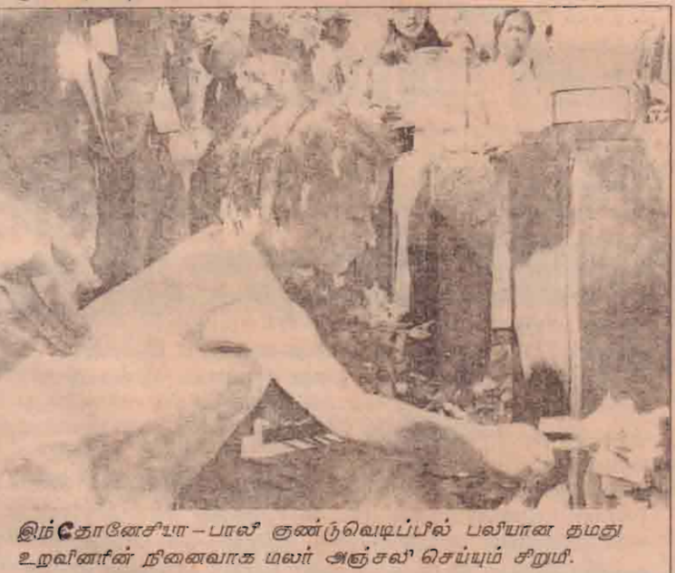
இந்தோசேசியா - பாஸீ குண்டு வெடிப்பில் பலியான தமது உறவினரின் நினைவாக மலர் அஞ்சல் செய்யும் சிறுமி.

மனைக் கட்டடத்திற்குத் தீ வைத்துவிட்டார். இந்தத் தீவேகமாகப் பரவியதால் அங்கு சிகிச்சை பெற்று வந்த அனைத்தீயில் சிக்கிக் கொண்டனர். நோயாளிகள் அனைவருமே தீ பரவுவதை உணராத மயக்க நிலையில் இருந்தமையினால் தான் 30 பேர் உடல் கருகிமரணமடைய நேரிட்டதாகக் கூறப்பட்டுள்ளது.