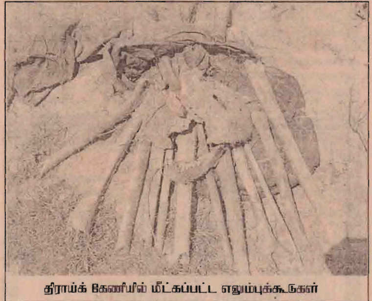
திராய்க் கேணியில் மீட்கப்பட்ட எலும்புக்கூடுகள்

திகதி சிறிலங்கா இராணுவத்தினர் மேற்கொண்ட படுகொலை நடவடிக்கையில் 58 பொதுமக்கள் கொல்லப்பட்டனர். இவ்வாறு கொல்லப்பட்டவர்களின் சிதைவுகளை இவ்வெலும்புக்கூடுகள் என அப்பகுதி மக்கள் தெரிவிக்கின்றனர்.