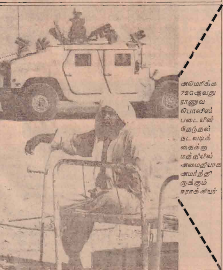
அமெரிக்க 720 ஆவது ராணுவ பெராலீஸ் படையின் தேடுதல் நடவடிக்கைக்கு மத்தியில் அமைதியாக அமர்ந்திருக்கும் ஈராக்கியர்