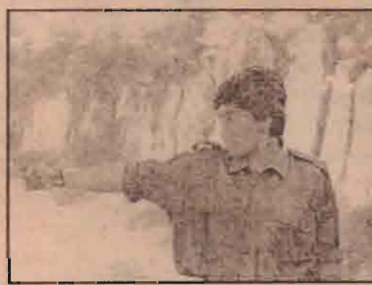
மாவட்ட அமைச்சர் மருத்தவப் பொருள்