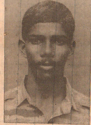
வரவேங்கை ஆஞ்சனேயன் (8ந்நூரு)

பாடசாலை மாணவர்கள் பாடசாலைகளினூடாகவும் தனியார் பரீட்சார்த்திகள் நேரடியாகவும் இத் திகதிக்கு முன்னர் விண்ணப்பிக்க வேண் டும். இவ்வாரத்தில் மாதிரி விண்ணப்பப்படிவம் பத்திரி கைகளில் பிரசுரமாகும் என் றும் அவர் மேலும் தெரிவித் தார்.