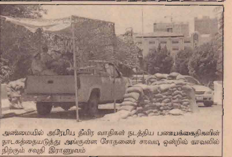
அண்மையில் அரேபிய தீவிர வாதிகள் நடத்திய பணயக்கைதிகளின் நாடகத்தையடுத்து அங்குள்ள சோதனைச் சாவடி ஒன்றில் காவலில் நிற்கும் சவுதி இராணுவம்