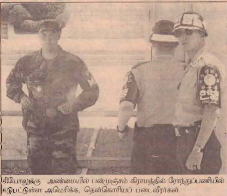
சியோலுக்கு அண்மையில் பன்முஞ்சம் கிராமத்தில் ரோந்துப்பணியில் ஈடுபட்டுள்ள அமெரிக்க, தென்கொரியப் படைவீரர்கள்.

அதேவேளை எதிர்வரும் சனவரி மாதம் பதவிக்கு வரவிருக்கும் இடைக்கால அரசாங்கம் வெளிநாட்டு இராணுவத்தை ஈராக்கில் இருந்து வெளியேறக் கோரி வற்புறுத்தக்கூடும் என அவர்கள் தெரிவித்துள்ளனர்.