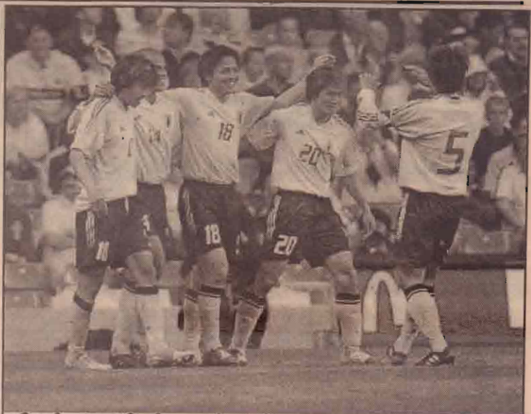
இங்கிலாந்துக்கெதிராக பிரான்சில் நடைபெற்ற உதைபந்தாட்டப் போட்டியை 1-1 என்று சமன்செய்த யப்பானிய வீரர்கள் மகிழ்ச்சியில் காணப்படுகின்றனர்.

மேற்படி இரு அணிகளுக்கும் இடையிலான இரண்டாவது டெஸ்ட் போட்டி நாளை ஜமேக்காவில் நடைபெறவுள்ளது.