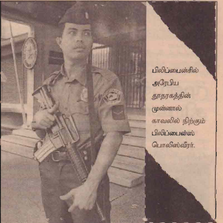
பிலிப்பைன்சில் அரேபிய தூதரகத்தின் முன்னால் காவலில் நிற்கும் பிலிப்பைன்ஸ் பொலீஸ்வீரர்.

இவர் தேர்தல் நடத்தத் தவறிய தாக குற்றம் சாட்டப்பட்டே மன்னரால் பிரதமர் பதவியிலிருந்து நீக்கப்பட்டமை குறிப்பிடத்தக்கது.