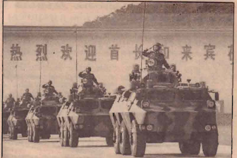
சீனாவுக்கு ஐரோப்பிய சமூகத்தின் ஆயுதங்கள் விற்பனைசெய்யத்தடைவிதித்து 15 வருடங்கள் பூர்த்தியாகும் நிலையில் சீனாவில் அணிவகுத்து நிற்கும் கவசவாகனங்கள்.

பீகாரில் நதியில் பயணித்துக் கொண்டிருந்த படகு கவிழ்ந்ததில் 16 பேர் காணாமல் போயுள்ளனர். பீகாரில் சரான் மாவட்டத்தில் ஆலங்கட்டி மழை தொடர்ச்சியாகப் பெய்தமையினால் நேற்றுமுன்தினம் நதியில் பயணிகளை ஏற்றிச்சென்ற படகொன்று கவிழ்ந்துள்ளது. இதுவரை 23 சடலங்களை பொலீசார் மீட்டுள்ளனர். ஏனையவர்களை மீட்கும் பணி தொடர்வதாக பொலீசார் கூறியுள்ளனர்.