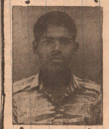
2ஆம் லெப். செம்பியன்