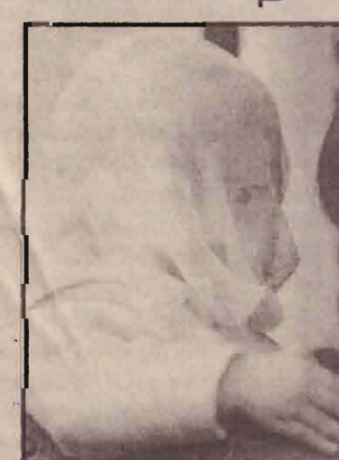
ஹொங்க்காங்கில் வைரஸ் காய்ச்சலில் இருந்து பாதுகாக்க குழந்தை ஒன்றின் முகம் மூடிக்கட்டப்பட்டுள்ளது.

உஸ்கனாவிய ரீதியில் வைரஸ் காய்ச்சல் அச்சுறுத்தல் அதிகரித்து வருகிறது. சுமார் 60 பேர் அண்மைக்காலத்தில் உயிரிழந்துள்ளதோடு 1600 பேருக்குத் தாதுகொண்ட பாதிக்கப்பட்டுள்ளனர்.