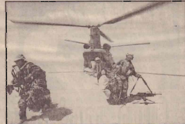
ஈராக் பாலைவனம் ஒன்றில் அமெரிக்கா CH-47 உலங்கு வானூர்தி ஒன்று படையினரை தரையிறங்குக்கிறது.

மத்திய ஈராக்கில் முன்று குண்டுகள் வீழ்ந்து வெடித்ததனால் பெருமளவு சேதம் ஏற்பட்டது என்றும் தீர்க்கவாலையும் வானத்தில் புகைமண்டலமும் நிறைந்து காணப்பட்டது என்றும் தெரிவிக்கப்படுகின்றது. குறித்த இலக்கை ஏவுகணைகள் தாக்கி உள்ளனவா? என்பது பற்றி எதுவும் கூறுமுடியாதது எனதாக அமெரிக்க இராணுவ அதிகாரிகள் தெரிவித்துள்ளனர்.