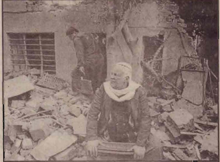
விமானக் குண்டு வீச்சில் சேதமுற்ற தனது வீட்டின் இடிபாடுகளிடையே அமர்ந்திருக்கும் ஈராக்கிய வயோதீபர்

காப்பு அமைச்சர் தெரிவித்துள்ளார். ஈராக்கின் இவ்வாறான எதிர்ப்புக்கு இடையில் அமெரிக்க இராணுவத்தின் பாக்தாத் மீதான முற்றுகை தொடர்வதாகவும் இந்த முற்றுகையின் போது ஆயிரக்கணக்கான ஈராக் துருப்புக்கள் கொல்லப்பட்டிருக்கலாம் என்று அவர் குறிப்பிட்டார்.