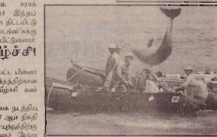
உம் கசார் துறைமுகப்பகுதியில் கடற்கண்ணீர்கள் சுண்டு பீடிக்கும் பயிற்றப்பட்ட டொல்பின் இன மீனிடன் பீரிட்டிஷ் கடற்படையினர்.

குவைத்தில் நேற்று இராணுவ வண்டியொன்று மோதித் தள்ளியதில் 13 அமெரிக்க இராணுவத்தினர் காயமடைந்தனர். வரிசையாக நின்றிருந்த இராணுவத்தினர் மீதே இந்த டர்க் வண்டி மோதியது.