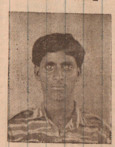
2-ம் லெப். தங்கள்