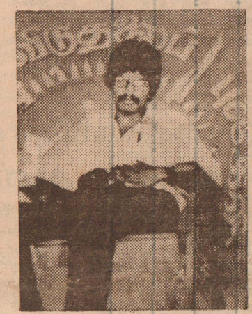
பித்து வைக்கப்பட்ட இவ் உண்ணாவிரத நிகழ்வுகள் மாலை 5-00 மணிக்கு நீரா

காரம் வழங்கலுடன் முடித்து வைக்கப்பட்டது- குடாநாட் டின் அனைத்து வீதிகளிலும் டிருசள் சிவப்பு நிற கொடிகள் பறக்க விடப்பட்டிருப்பதுடன் வாழை தோரணங்கள் கட்டப் பட்டிருந்தன-