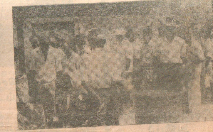
சுன்னாகத்தில் நேற்று முன்தினம் தமிழ்மு காவல்துறையினரால் கைப்பற்றப்பட்ட மண்ணெண்ணெய் பொது மக்களுக்கு விநியோகிக்கப்படும் காட்சி.

(கிளிநொச்சி) கிளிநொச்சி மாவட்டத்தில் பல பகுதிகளிலும் சிறிலங்கா விமானப்படையினர் குண்டு தாக்குதல் நடாத்தியுள்ளனர். உமையாபுரம் குமரபுரம், மறும் அதனை அண்டிய பகுதிகளிலும் இயக்கச்சிப்பகுதியிலும் இக்குண்டு வீச்சுத் தாக்குதல்கள் நடாத்தப்பட்டிருக்கின்றன. காலை 8.30 மணியளவில் மேற்படி பகுதிக்கு விரைந்துவந்த