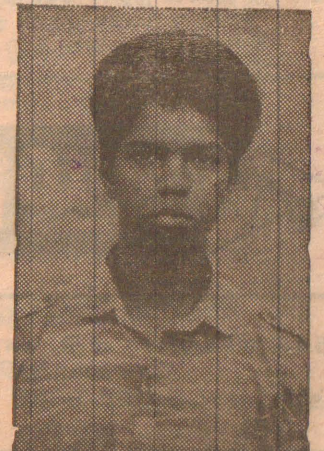
வெப் கனத்தீஸ்வரன் (நிலாந்)