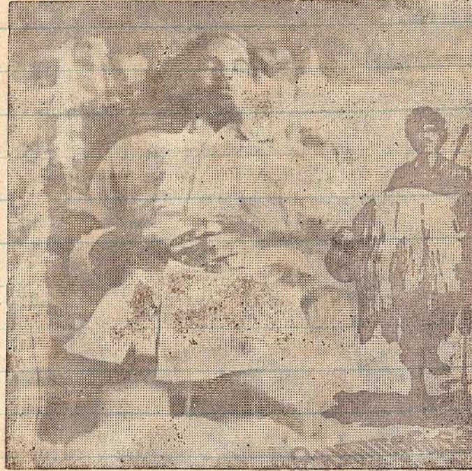
வீரமரணமடைந்த நிலையில் 2ஆவது லெப் ஆனந்தி.

இடத்தில்வைத்து, மிகவும் நேர்த்தியாக ராதை செய்து முடிப்பாள்..... பார்க்கும்பொழுதே சரப்பிட வேண்டும்போல இருக்கும்.