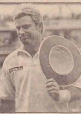
ஷேன்வோன் பந்துவீச்சில் முதலிடத்தைக் கைப்பற்றியுள்ளார்.

ஐ.சி.சி. டெஸ்ட் தரவரிசை பட்டியலில் பத்து ஆண்டு களுக்குப்பின் அவுஸ்திரேலியாவின் ஷேன்வோன் பந்துவீச்சில் முதலிடத்தைக் கைப்பற்றியுள்ளார். சர்வதேச கிரிக்கெட் சபை (ஐ.சி.சி) புதிய தரவரிசை பட்டியலை நேற்று முன்தினம் வெளியிட்டது. ஒருநாள் பட்டியலில் இந்திய அணி (104 புள்ளி) தொடர்ந்து ஏழாவது இடத்திலே நீடிக்கிறது. டெஸ்ட் பட்டியலில் அவுஸ்திரேலியாவின் ஷேன்வோன் (880) பத்து ஆண்டுகளுக்குப்பின்னர் பந்து வீச்சில் முதல் இடத்தைக் கைப்பற்றியுள்ளார்.