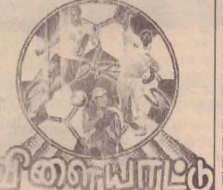
செவிப்புலன் வலுவற்றோருக்கான விளையாட்டுப் போட்டி.