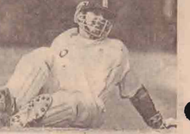
இங்கிலாந்து கிரிக்கெட் அணித்தலைவர் மைக்கேல் வோன்.