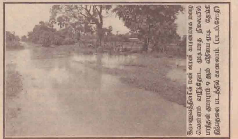
கிராமத்தினர் மண் அள்ள காரணமாக மழை வெள்ளம் வந்ததோட மூடியாத நிலையில் மாத்தளன் குறையும் 9 ஆம் வீதியை குடி தேங்கி நிற்குதனை படத்தில் காண்க. (பா.ம.சோதி)

பட்டப்படிப்பை முடித்துவிட்டு பல வருடம் காத்திருந்து ஆசிரியர் நியமனம் கிடைத்த பொழுதிலும் பணியினை மேற்கொண்டு அதற்கான வேதனத்தைப் பெறமுடியாத நிலையிலுள்ளோமென அண்மையில் நியமனம் பெற்ற பட்டதாரி ஆசிரியர்கள் கவலை தெரிவித்துள்ளனர். (சோ)