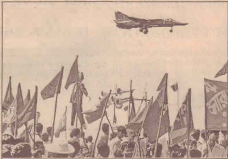
மேற்கு வங்காளத்தில் கொல்கத்தா அருகே உள்ள கலாய்தண்டா விமானப் படைத் தளத்தில் இந்திய-அமெரிக்க விமானப்படைகளின் கூட்டுப் பயிற்சி நடந்து வருகிறது. அமெரிக்கப் படைகள் இந்தியாவில் பயிற்சிபெற கொள்வனவுக் கமிட்டிக்கு கம்யூனிஸ்ட் கட்சியினர் நேற்று முன்தினம் ஆர்ப்பாட்டம் நடத்தினர். அதன் அருகே பயிற்சியில் ஈடுபட்டுள்ள இந்திய விமானப்படை விமானம் ஒன்று பறந்து கொண்டுள்ளது.