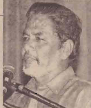
தமிழ் மக்களைப் புலிகள் கோரு வதைச் சர்வதேச சமூகம் எப்படி (12ஆம் பக்கம் பார்க்க)

இலங்கை இனப்பிரச்சினைக்காக சிறிலங்கா தரப்புக்கு சர்வதேச சமூகம் அளித்த அனைத்து வாய்ப்புகளையுமே அடி முட்டாள்தனமாக நிராகரித்துவிட்ட நிலையில் தொடர்ந்தும் சிங்களத் தரப்பின் மீது நம்பிக்கை வைத்து தமிழர் தரப்பைப் பேச்சு மேசைக்கு சர்வதேச சமூகம் ஏன் அழைக்க வேண்டும்? என்று தமிழ்ம விடுதலைப்புலிகளின் முக்கிய உறுப்பினர் க.வே.பாலகுமாரன் கேள்வி எழுப்பியுள்ளார்.