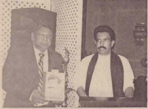
தீபுஜேசி மாநிலத்தில் நடைபெற்ற இந்தச் சிறப்பு விழாவில் அமெரிக்காவின் பல்வேறு பகுதிகளிலிருந்தும் நாற்றுக்கணக்கானோர் கலந்து கொண்டனர்.

அமெரிக்க இலங்கைத் தமிழ்ச் சங்கம் தனது 28ஆவது ஆண்டு நிறைவு விழாவை கடந்த நான்காம், ஐந்தாம் திகதிகளில் வெகுசிறப்பாகக் கொண்டாடியது. அமெரிக்காவில் சுழத்த தமிழர்கள் அதிகம் வாழும்