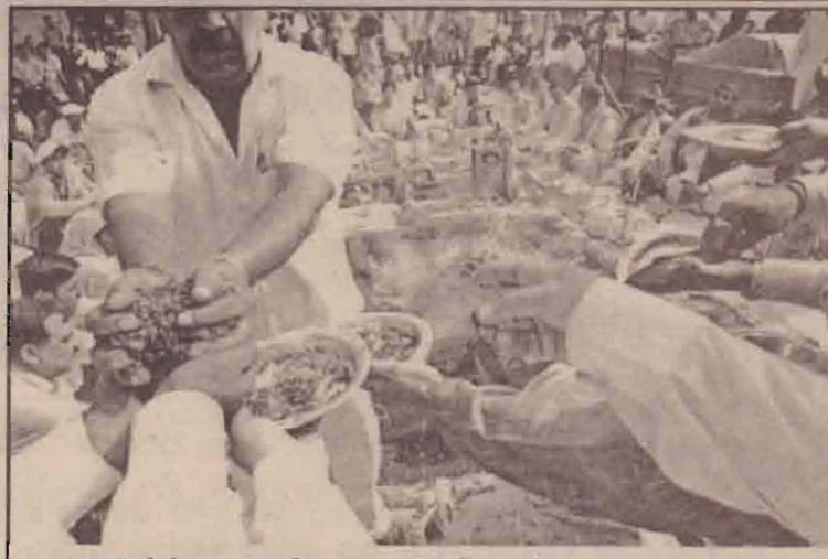
புதுடில்லியில் நடந்த தொடர் குண்டு வெடிப்பில் பலியானவர்களுக்கான 13ஆம் நாள் சுடங்குகள் சரோஜினி நகர் பகுதியில் சுடந்த வெள்ளிக்கிழமை நடந்தது.

சதாமுக்கு 09-08-2001 இல் அப்போதைய பிரதமர் வாஜ்பாய் எழுதிய கடிதத்தின் நகலையும், காங்கிரஸ் வைத்துள்ளது. அதை நஜ்மா ஹெப்தல்லா தலைமையிலான சிறப்பு நல்லெண்ண குழு எடுத்துச் சென்று சதாமிடம் கொடுத்துள்ளது. அதில் இரு நாடுகள் இடையே நட்புறவு நடிக்கும் அதைப் பலப்படுத்துவதில் கவனம் செலுத்து வேண்டும் என்று வாஜ்பாய் குறிப்பிட்டுள்ளார்.