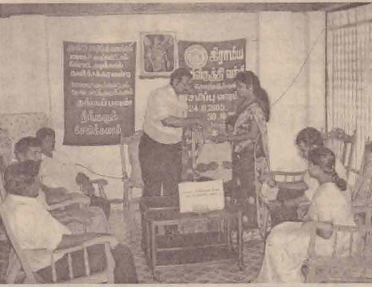
(அலுவலகசெய்தியாளர்) கணக்கில் வைப்பிலிட்டு குலுக்கல் சேமிப்பு வாரத்தில் கிராமிய மூலம் தெரிவு செய்யப்பட்டவர்களின் அபிவிருத்தி வங்கியில் சேமிப்புக் பெயர் விபரங்களை கிராமிய அபி