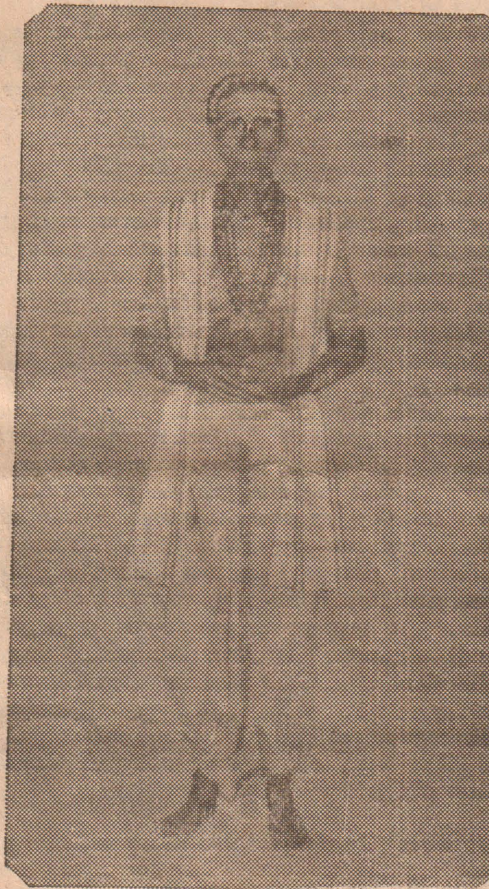
குருமணி தன் தாள் வாழ்க