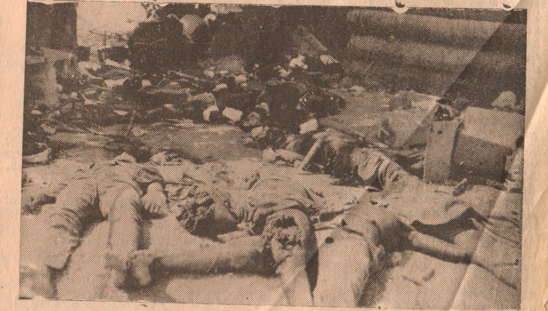
விடுதலைப் புலிகளால் தகர்க்கப்பட்ட பூநகரி முகாமின் சிதறிக்கிடக்கும் சிப்பாய்களின் சடலங்கள்.

உள்ளே பூநகர் முகாம் தகர்ப்பில் வீரச்சாவடைந்த ஏனைய போராளிகளின் வீரம் உள்ளே.