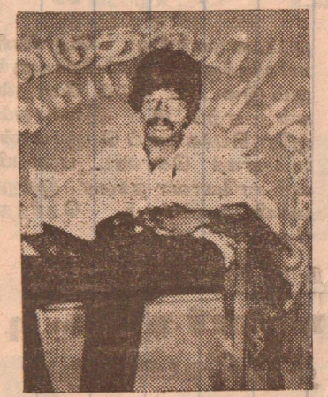
எவ்வாறு இந்திய இராணுவத்தை அமைதிக்காகும்படையினர் என ஏற்றுக் கொள்ள முடியும் இச்சமூக விரோதக் கும்பல்களுக்கு இந்திய இராணுவம் துணை போவதாக உள்ளது. நாம் தாக்கப்படும்

பட்டனர். ஆனால் இதே வேளை இந்திய இராணுவத்தினர் அருகே இருந்தார்கள். இந்திய இராணுவம் அதைப் பார்த்துக்கொண்டதான் இந்த துடிக்கம் வராயின் நாம்