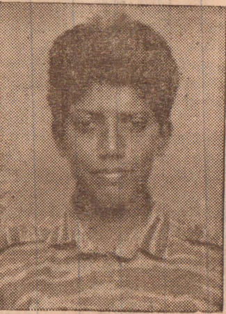
2-ம் லெப். தேவானந்தி (பண்டத்தரிப்பு) நோக்கி நேற்று முன்னேறிய சிறிலங்கா (4 ஆம் பக்கம் பார்க்க)