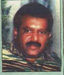
தமிழீழத் தேசியத் தலைவர் மேதகு வே. பிரபாகரன் அவர்கள்

அடக்குமுறையாளர்கள் போராளிகளை அழிப்பதில் காட்டும் தீவிரத்தைவிட, பொதுமக்களின் ஆன்மீக உறுதியை உடைக்க வேண்டும் என்பதில் தான் அதிக அக்கறை காட்டுகின்றனர்.