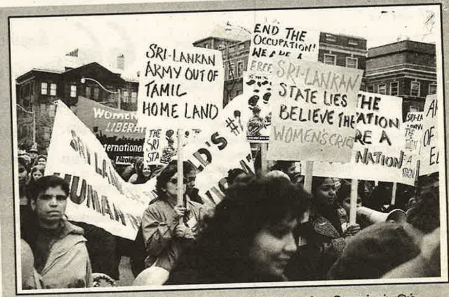
சிந்லங்கா அரசுபடையினரால் தமிழ்ப் பெண்களுக்கு இழைக்கப்படுகின்ற கொடுமைகளை வெளிப்படுத்தி, கனடாவில் தமிழ்ப் பெண்கள் நடத்திய ஊர்வலம். அனைத்துலகப் பெண்கள் நாளில், திரண்டெழுந்த பலநூறு தமிழ்ப்பெண்கள், தமிழீழத் தாயகத்தில் இருந்து சிங்கள ஆக்கிரமிப்புப்படை வெளியேறவேண்டும் எனக் குரலெழுப்பினர்.

அன்னையின் தியாகவேள்வி முடிவடைந்து இப்போது 12 ஆண்டுகள் பூர்த்தியாகி விட்டது. தன்னுடைய உன்னத தியாகத்தால் தமிழ் பேசும் மக்களின் நெஞ்சங்களில் நிலைத்துவிட்ட அன்னை அவர்களுக்கு எமது வீரவணக்கத்தைத் தெரிவித்துக் கொள்கிறோம்.