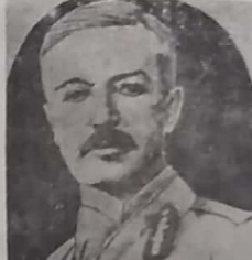
ஜெனரல் ரெஜினால்ட் எட்வர்ட் ஹரி டயர் இப்படுகொலையில் மட்டுமல்லாமல் பிற்பகுதியில் மொத்த ஜெனரல் டயர் மீது குண்டடித்து விடுத்தவர் களது முன்கூறி எவர்க்குக் கேட்டி -

கனா என ஒரு விவரத்தைக் குறித்து அங்கத்தவர் கேட்ட கேள்விக்கு "ஆம்" என ஜெனரல் டயர் பதிலளித்தார்.