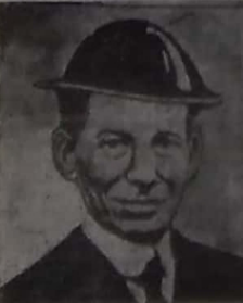
ஆளுநர் ஸைக்கல் ஓ டயர் சில மக்களின் எதிர்ப்பை ஆரம்பம் கொண்டு ஓடுக முடிவு செய்தார்.

இந்திய மக்களின் மனத்தைப் பூர்த்தியாக்கிய ஆளுநராக இருந்த ஸைக்கல் ஓ டயர் (Sydney O'Day) என்ற பிரிட்டிஷ் காரைத் தனது ஆட்சியை நடத்தினார்.