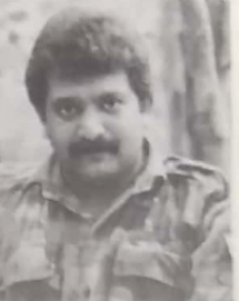
மாண்புமிகு பேரவைத் தலைவர் இராஜகாரணம்

சமாதானப் பேச்சுக்கள் தவறுவதற்கு முன்பு மக்கள் மனப்பான்மை விரிவாக்கம், ஒரு சமரச முயற்சி செய்தல் தவிர வேறுவிதம் தவறுவதற்கு நாம் திட்டமிட்டிருக்கிறோம்.