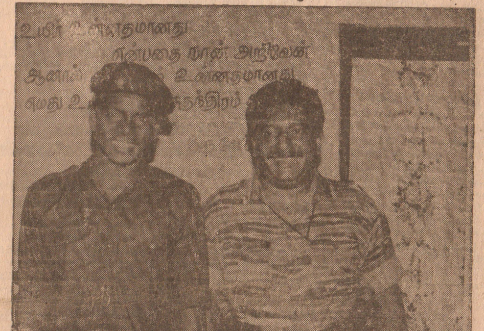
தேசியக் தலைவர் பிரபாகரனுடன், பூநகரி முகாம் தகர்ப்பில் வீரச்சாவடைந்த முதற்கடற்குருப்புவி மேஜர் கணேஸ்