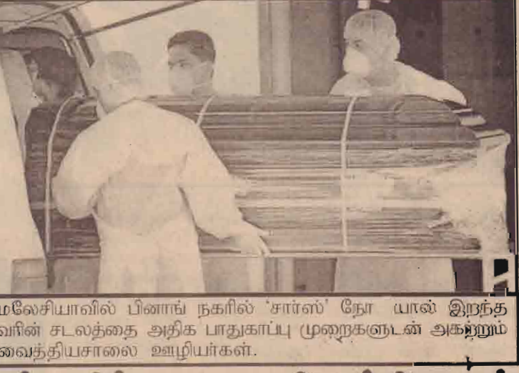
மலேசியாவில் பிளாப் நகரில் 'சார்ஸ்' நோயால் இறந்தவரின் சடலத்தை அதிக பாதுகாப்பு முறைகளுடன் அகற்றும் வைத்தியசாலை ஊழியர்கள்.

இந்தியாவில் மத்திய, தெற்கு அசுமீல் நேற்று முன்தினம் வீசிய கடும் புயலில் குறைந்தது 40 பேர் இறந்திருக்கலாம் என்று கூறப்படுகின்றது. அத்தூடன் இக்கடும் புயலினால் நூற்றுக்கணக்கானவர்கள் காயமடைந்துள்ளதோடு பலர் காணாமல் போயுள்ளனர். மணிக்கு 80 கிலோமீட்டர் வேகத்தில் புயல்காற்று வீசியது.