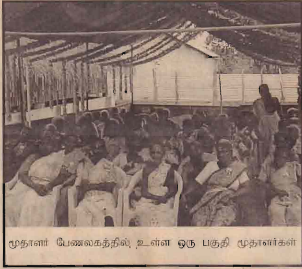
மூதாளர் பேணலகத்தில் உள்ள ஒரு பகுதி மூதாளர்கள்