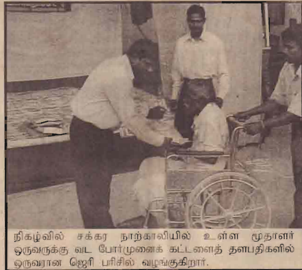
நிகழ்வில் சக்கர நாற்காலியில் உள்ள மூதாளர் ஒருவருக்கு வட போர்முனைக் கட்டளைத் தளபதிகளில் ஒருவரான ஜெரி பரிசில் வழங்குகிறார்.