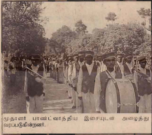
மூதாளர் பாண்ட் வாத்திய இசையுடன் அழைத்து வரப்படுகின்றனர்.