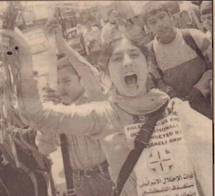
காஸாவின் தென்பகுதி ர்பா அகதி முகாம் தாக்குதலைக் கண்டித்து ஆர்ப்பாட்டம் செய்யும் பிரிட்டிஷ் சமாதான விரும்பிகள்.

ஆனால், ஈராக்கைத் தொடர்ந்து வேறு எந்த நாட்டின் மீதும் உடனடியாகப் போர் தொடுக்கும் திட்டமெதுவும் அமெரிக்காவின் இல்லை என்று சனாதிபதி ஜோர்ஜ் டி.பி.புஷ் கூறியுள்ளார். பத்திரிகைச் செய்தியாளருக்கு பேட்டியளித்த புஷ் இதனைத் தெரிவித்ததாக 'நியூஸ் வீக்' பத்திரிகை தகவல் வெளியிட்டுள்ளது.