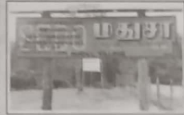
இடம்பெயர்ந்த மக்களுக்கான மாதிரி கிணங்கால் வளர்ப்பு முயற்சிகள் இயங்கும் இடங்களாகும்.