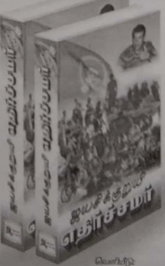
வெளியீடு தமிழீழ விடுதலைப் புலிகள் அணைத்துலகச் செயலகம்

சாதாரண சமரல்ல சமர்களுக்கெல்லாம் தாய்ச் சமராச எமது மண்ணில் நிகழ்ந்த பெரும் சமர் ஜயசுக்குறியி எதிர்ச்சமர் சினீயழைப்பேழையாய் வெளிவந்துவிட்டது.