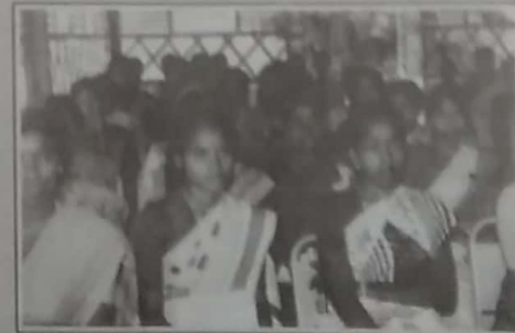
உழைப்பவர்களை இழந்த பொருள்களுக்கு தெரிந்துவிடுதலை அளிப்பது முதல் கல்விமையங்கள் - மறுமீட்டல் கல்விமையங்கள் ஆகியவற்றை மேற்கொண்டு உதவி அளிப்பது என பல்வேறு செயல்கள் அமுல்படுத்தி திட்டங்களை அமுல்படுத்தி வருகின்றது.

தமிழீழத்தில் சமூக பொருள்கள் மேம்பாட்டிற்கும் வித்தூதல் பூர்வணம் திட்டம் செயல்படுத்தப்படும் தமிழீழபெருநகரம் மேம்பாட்டுக்கழகம் பல்வேறு செயல்திட்டங்களை அமுல்படுத்தி வருகின்றது.