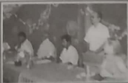
நுகர்வதற்கும் ஆரம்பக்கட்ட மேற்கொண்ட இயங்கும் இடங்களாகும்.

வழிவழித்தவர்களை மதுகாட்டுவதற்கும் உதவுவதற்கும் பல்வேறு சர்வதேச அமைப்புகளுடன் இணைந்து வளர்ந்து திட்டம் மேற்கொண்ட புனர்வாழ்வுக் கழகம் நடத்தி வருகின்றது.