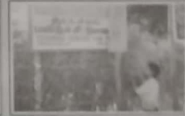
இடம்பெயர்ந்தோருக்கு மேற்கொண்ட உதவிகளை அளிக்கும் மாதிரி கிணங்கால் வளர்ப்பு முயற்சிகள் இயங்கும் இடங்களாகும்.