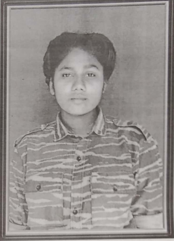
வெப். கேணல் நத்தி

பிடிச்சு, சுடுவன் என்று பின் இவளின் காயம் மாறினாலும் கை ஒன்று இயலாமல் போனது இவளது திறமையை பார்த்த மருத்