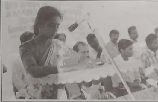
1985ல் தமிழர் புனர்வாழ்வுக்கழகம் மக்களின் பராமரிப்புக்கான பணிகளுக்காக உருவாக்கப்பட்டது. 1987ல் தமிழ் பகுதிகள் எங்கும் புனர்வாழ்வுக்கழகத்தின் பணிகள் விரிவடைந்தன.

சிங்கள அரசின் போரினால் சிதைக்கப்படும் மக்களின் நாளாந்த வாழ்க்கை விநாசிக்கடிகளை எதிர்கொள்வதற்கும் உடனடி, இடைக்கால நிவாரணங்களை வழங்குவதற்கும் தமிழர்கள் தமக்காவ சயமான உட்கட்டுமானங்களை நிறுவி வருகின்றனர். இவ் அமைப்புகள் மக்களின் தேவைகளை பூர்த்திசெய்யும் செயற்திட்டங்களுடன் பரிணாம வளர்ச்சி கண்டு வருகின்றது.