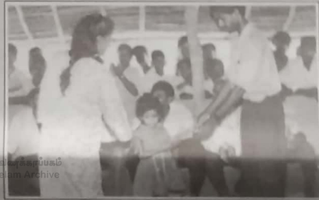
சிறுமக்களின் அடிப்படை உபகரணங்களை வழங்குவதற்கும் கல்விமையங்களை மீட்டவும் உதவுவதற்கும் புனர்வாழ்வுக் கழகம் உட்கட்டுமானங்களை செய்து வருகின்றது.