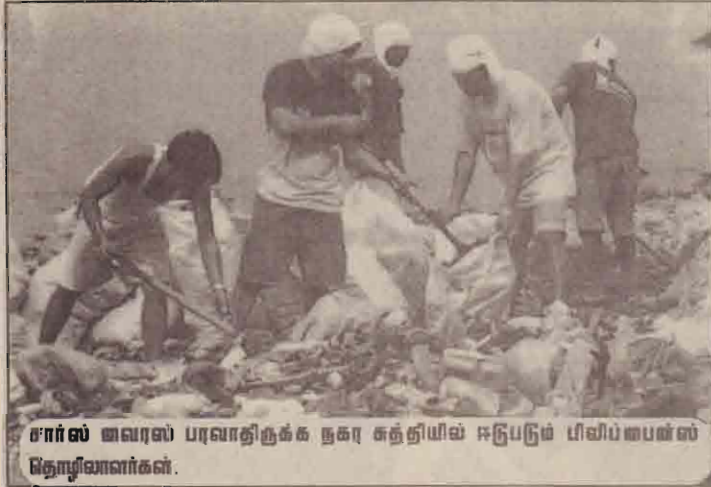
சார்ஸ் வைரஸ் பரவாதிருக்க நகர சுத்தியில் ஈடுபடும் பிவிப்பைஸ் தொழிலாளர்கள்.

சார்ஸ் என நோயின் பெயரை சுருக்கி விட்ட மருத்துவ உலகம் ஏனோ நோயை சுருக்கவோ, இல்லாமல் அழிந்துவிடவோ முடியாமல் திண்டாடுகின்றது. உயிர் கொல்லி