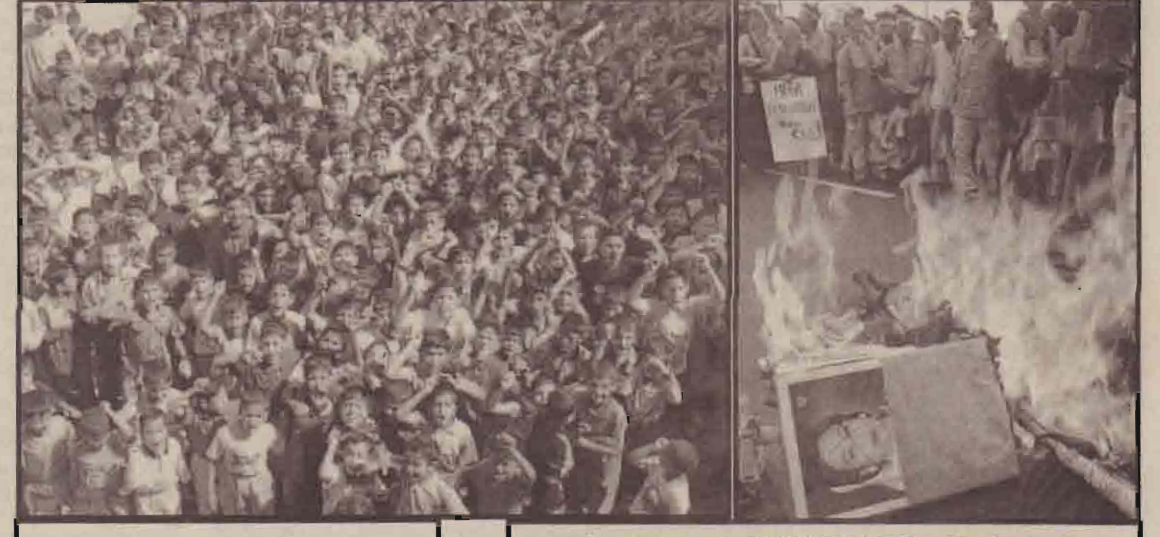
பாத்தாத்திற்கு 50 கி.மீ. தூரத்திலுள்ள புளுகாவில் ஈரக்கிய பள்ளி மாணவர்கள் அமெரிக்க எதிர்ப்பு ஆர்ப்பாட்டத்தில் ஈடுபடுகின்றனர்.

நேர்மையான பொலிஸ் அதிகாரிகள் மூலமே இந்தக் குற்றவாளியைக் கண்டு பிடிக்க முடியும் என்றும், தி.மு.க.வில் அண்ணா காலத்திலேயே உட்கட்சிப் பூசல் இருந்து வருவதாகவும், இதை வைத்துப் பொய் வழக்கு போட அ.இ.அ.தி.மு.க. அரசு முயல்வதாகவும் உட்கட்சி பூசல் என்பது எல்லா அரசியல் கட்சிகளுக்கும் பொதுவானது என்றும் அவர் கூறியுள்ளார்.