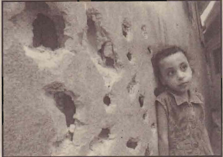
குப்பாக்கி ரணவகளைச் சேதமாக்கப்பட்ட தனது வீட்டின் சுவரில் சாய்ந்து நிற்கும் பலஸ்தீன சிறுமி.