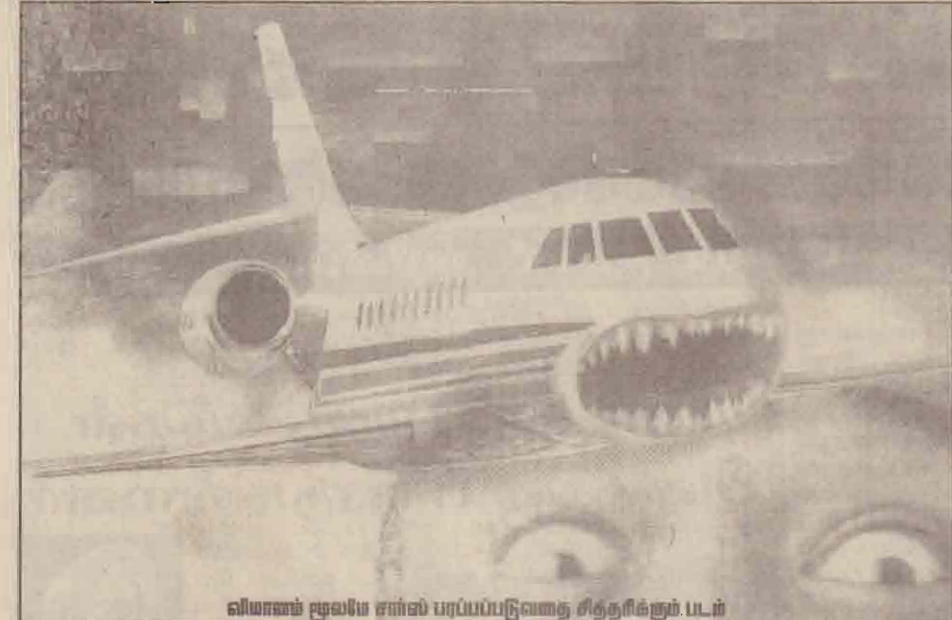
விமானப் பூலிய சார்ஸ் பரப்பப்படுவதை சித்தரிக்கும் படம்

இந்த நோயினால் உலக நாடுகளின் பொருளாதாரம் ஆட்டம் காண ஆரம்பிக்கும் நிலையில் உள்ளது. அதனையும் தாண்டி போக்குவரத்து, கல்வி, கலாச்சாரம், விளையாட்டு... என்பன எல்லாமே முடக்கப்பட்டும், தடுக்கப்