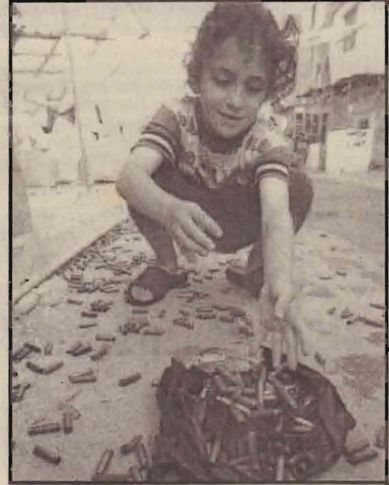
பலஸ்தீன சிறுமி யொருத்தி தென் வெபனானின் சிடான் நகரருகேயுள்ள அகதி முகாமிற்கு வெளியே ரணவெற்றிக் கவளங்களை சேகரிக்கிறார்.