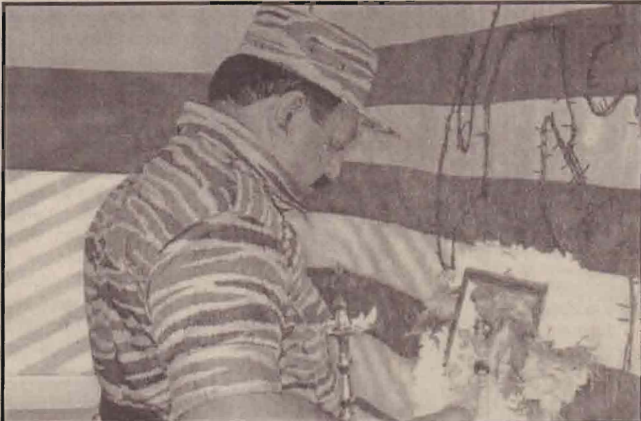
தியாக தீபம் லெப். கேணல் திலீபனின் 18ஆம் ஆண்டு நினைவின் முதல் நாளான நேற்று அவரின் திருவருவப்படத்திற்கு தமிழீழத் தேசியத் தலைவர் வே. பிரபாகரன் அவர்கள் ஈகச்சுடரேற்றி மலர்மாலை அணிவித்து மலர் வணக்கம் செலுத்தினார்.