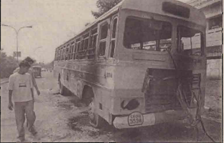
லூசியானா மாநிலம் கோகனா பகுதியில் வகுப்புக் கலவரம் நடந்தது. அதை யொட்டி நடந்த கடைமடையப்பு போராட்டத்தின் போது சாண்டிகார் நகரில் பேருந்து தீவைத்துக் கொளுத்தப்பட்டது.

சூறாவளிகள் தாய்வான், ஜப்பான், பிலிப்பைன்ஸ், ஹொங்கொங், தென் சீனா போன்ற நாடுகளில் காலத்துக்கு காலம் தாக்கத்தை ஏற்படுத்துமென அவதானிகள் கருத்துத் தெரிவித்துள்ளனர்.