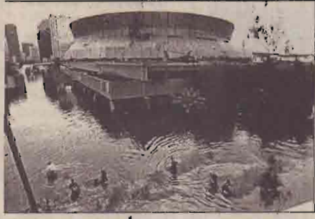
யிருந்தார். அதிலேயே மூடியாது நிவாரணப் பொருட்கள் உடனேயே அனுப்பி வைக்கப்படும் என்றும், மேற்படி பிரதேசம் வெகு விரைவில் வழமைக்குத் திரும்ப நடவடிக்கை எடுக்கப்படும் என்றும் உறுதியளித்திருந்தார்.

“கற்றிவா” என்று பெயர் சூட்டப்பட்ட சூறாவளி லூசியானா மாநிலம் முழுவதையும் கடந்த திங்கட்கிழமை தாக்கியிருந்தது. குறிப்பாக நியூஓர்லியன்ஸ் மற்றும் அதன் சுற்றுப்புறப்பிரதேசங்கள் கடுமையான பாதிப்புக்குள்ளானதுடன் தொடர்ந்தும் தேங்கியிருக்கும் வெள்ளம் மக்களின் போக்குவரத்திற்கான வசதிகளை முற்றாகத் துண்டித்துள்ளது. இந் நிலையில் அப்பகுதிகளில் சூறாவளி தாக்கி நான்கு நாட்கள் கடந்திப்போடே நிவாரணப் பொருட்கள் சிறிது சிறிதாகச் செல்லத் தொடங்கியுள்ளன. நியூஓர்லியன்ஸ் நகரம் மற்றும் அதன் சுற்றுப்புறங்கள் அமைந்திருந்த நிலப்பகுதி கடல் மட்டத்திற்கு கீழானதாக இருந்த காரணத்தால் கடல் பெருக்கெடுத்தால் வெள்ளம் ஏற்படும் அபாயமும் அறியப்பட்ட ஒன்றாகவே இருந்துவந்தது. எனினும் மானிட எதிர்பார்ப்பிற்கு மாறானவகையில் நீமட்டம் உயர்ந்த தோடு, அனைகளில் ஏற்பட்ட உடைப்பு உட்பட பல இன்னொரு காரணங்களால் அப்பிரதேசம் வெள்ளக்காடாகவே மாறி யிருந்தது.